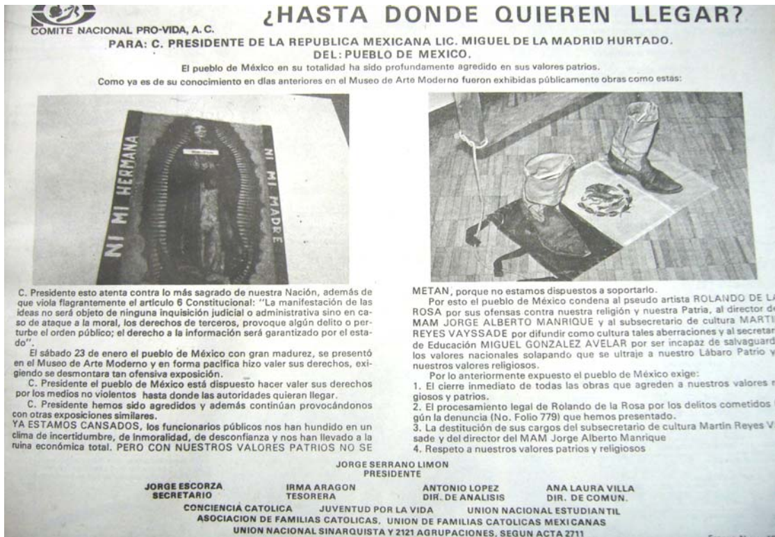
Foto19. El Heraldo de México