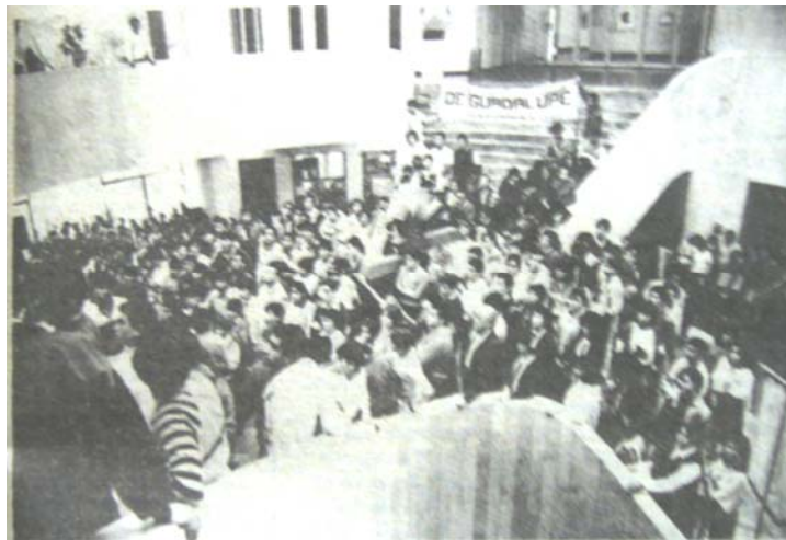
Foto11. La Jornada