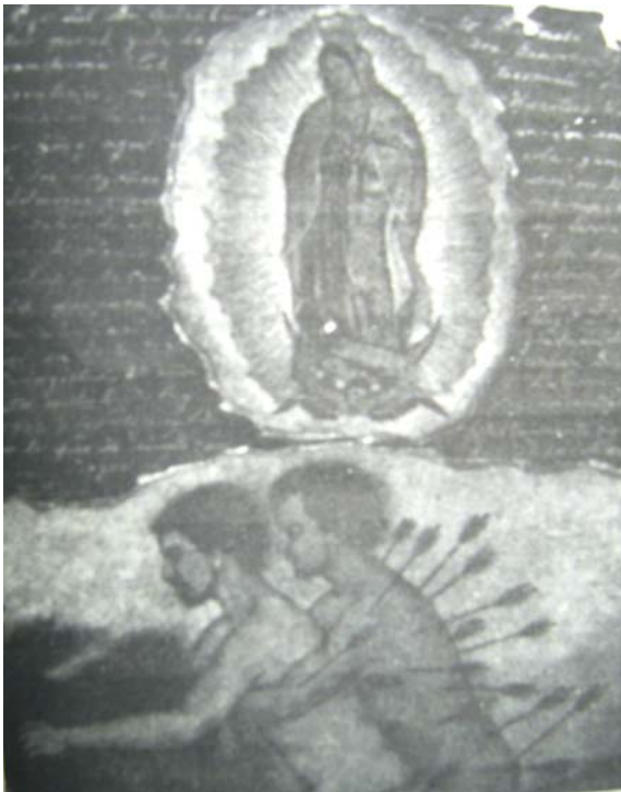
Foto 12. Quehacer Político .

Por lo pronto, el sábado no se abrió ninguna de las salas del Museo de Arte Moderno, y para prevenir una posible reapertura de la obra se designó una comisión encargada de vigilar diariamente que no se reinstalara el collage 96 .