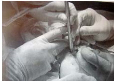
k. Harwick, Cyborg 2.0, 2002.

Poco a poco se va disolviendo en el entorno, al parecer ya la vieja disputa entre materia y espíritu, ahora nos enfrentamos a una disputa desorientadora del hombre con su propio cuerpo, como señala Iván Mejía y para la cual se encuentra ya un término, "cuerpo" no biológico, y que se puede indagar en una rama de lo poshumano, llamada transhumano; concepto que se define de la siguiente manera: "Movimiento intelectual y