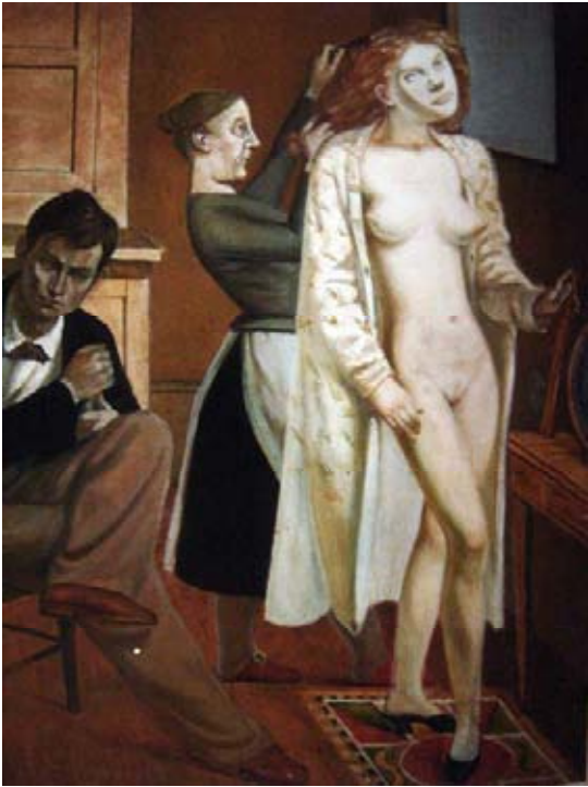
Balthus, Cathy vistiéndose , 1933.