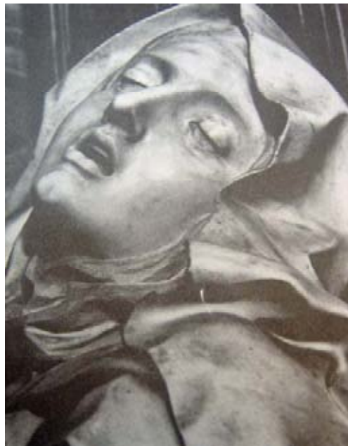
Bernini, La transverberación de Santa Teresa .

Georges Bataille, en su libro El erotismo , explicó la fusión entre la experiencia carnal y el arrobamiento místico. Ambas experiencias interiores nutren al ser aislado, “discontinuo” y preso de su condición mortal, de un sentimiento de continuidad profunda. Es la sensibilidad religiosa, que liga siempre estrechamente el deseo y el terror, el placer intenso y la angustia. Por su dimensión irracional y transgresora, por su intensidad emocional, la entrega amorosa, la fiebre mística y la muerte son pasiones comparables. 58