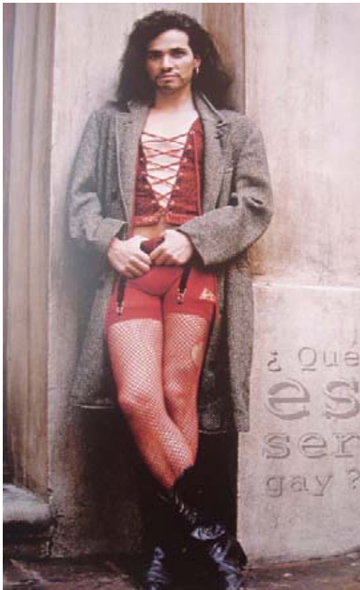
TDV, ¿Qué es ser Gay?