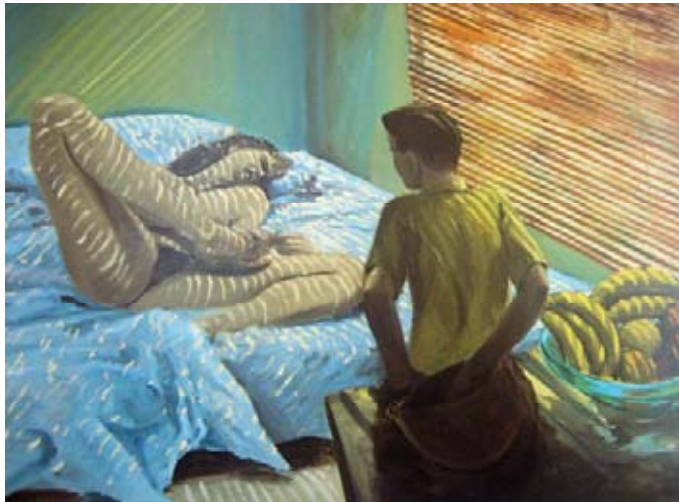
Erik Fischl, Bad Boy , 1981.

Cuerpo gozoso, provocativo, evocador de las prácticas sexuales femeninas, de la voluptuosidad que se ofrece a la mirada de un espectador adolescente, tal es la narrativa de la pintura realizada por Erik Fischl, Bad Boy de 1981.