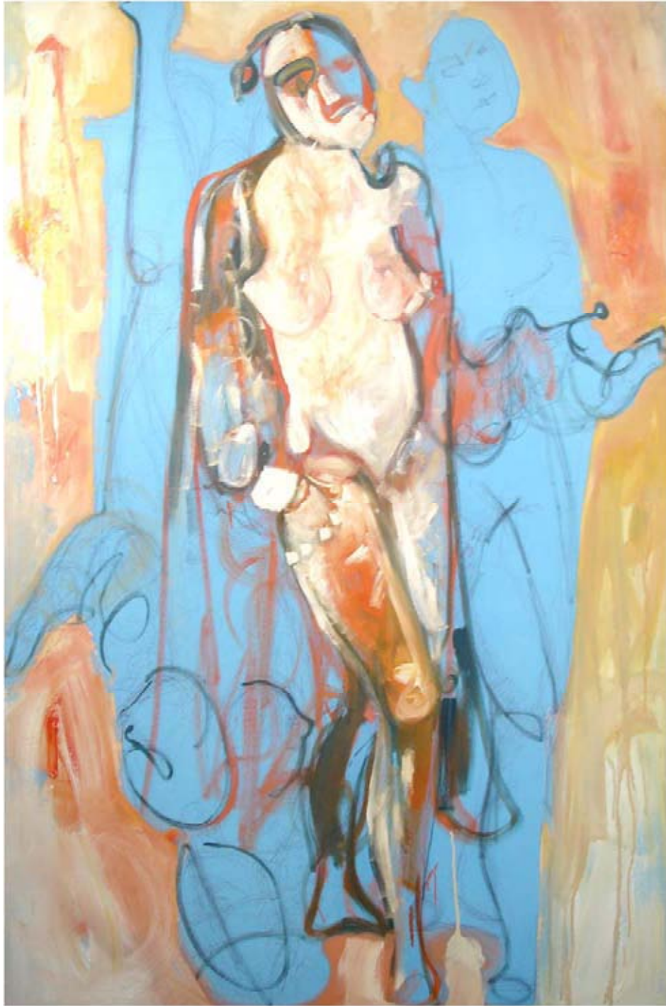
FIGURA 13 Guadalupe, Spente le stelle