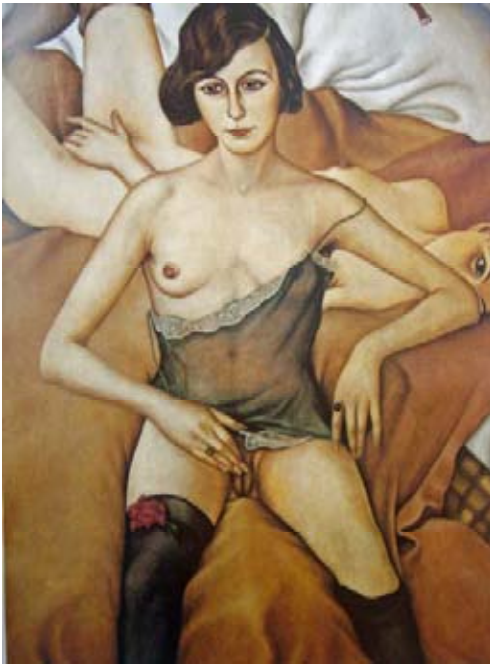
Cristian Schad, Girlfriends , 1930.