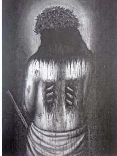
Anónimo, Ecce, Homo .

la iconografía religiosa que se desarrolló en la pintura de esa época; ejemplo de ello se precisa en la pintura anónima del siglo XIII, titulada Ecce Homo 48 .