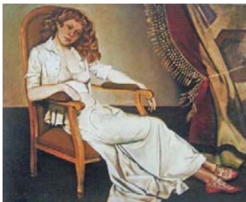
Balthus, La falda blanca , 1937

En una apreciación particular refiero que, la apropiación o la cita no es una práctica actual, muchos pintores han tomado referencias de múltiples obras que les anteceden, con ello se establece pues, que la apropiación aunque es causa de estudio reciente, se manifiesta como una practica anterior a nuestro presente; claro está, que otras son las motivaciones actuales, en torno a la apropiación, pero ello será problema de estudio en el capítulo tres de esta investigación teórico-práctica.