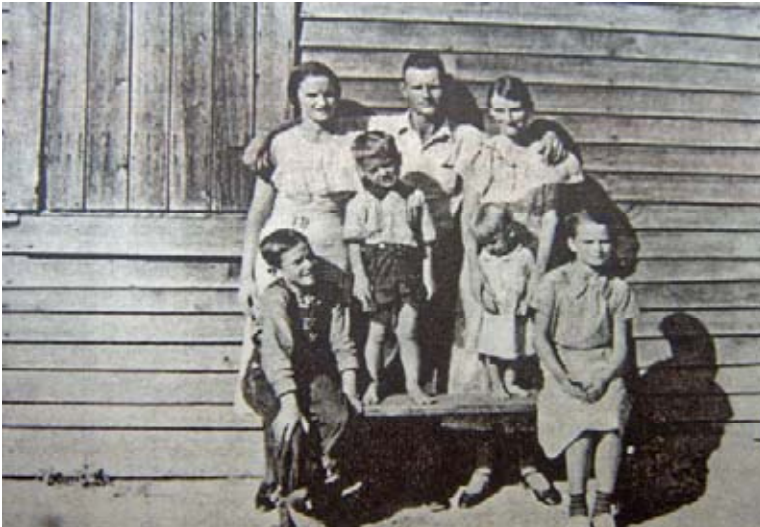
Sherrie Levine. Alter Walker Evans . 1981.

concepto de originalidad, por tanto su obra propone borrar todo rasgo de originalidad en el sentido tradicional de la utilización del término, ya que la misma se ha agotado y sólo nos queda contemplar sus ruinas; por tanto, su obra puede proponer este proceso de alimentación, en donde un organismo vive alimentándose de la descomposición de otros.