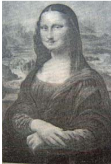
Marcel Duchamp. L. H. O. O. Q. 1919.

en la obra original, sino que, modifica el lenguaje total de la misma, quizá con una intención de parodiar la imagen, lo cual, es también una característica de las prácticas apropiacionistas.