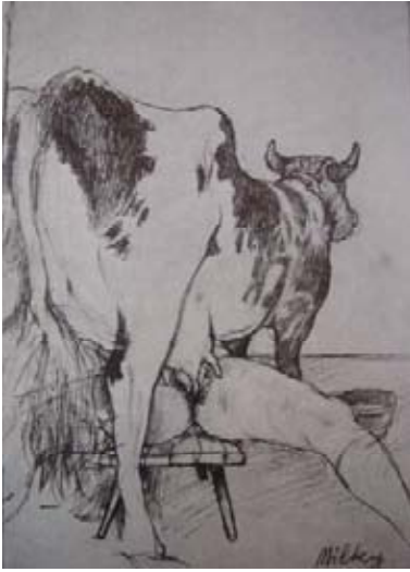
Günter Brus, Milky , 1970. 1973

formas de conseguir placer, cuerpos que se tocan así mismos, que se rozan con los animales en una liviandad que sólo se consigue a través del recurso de la soledad.