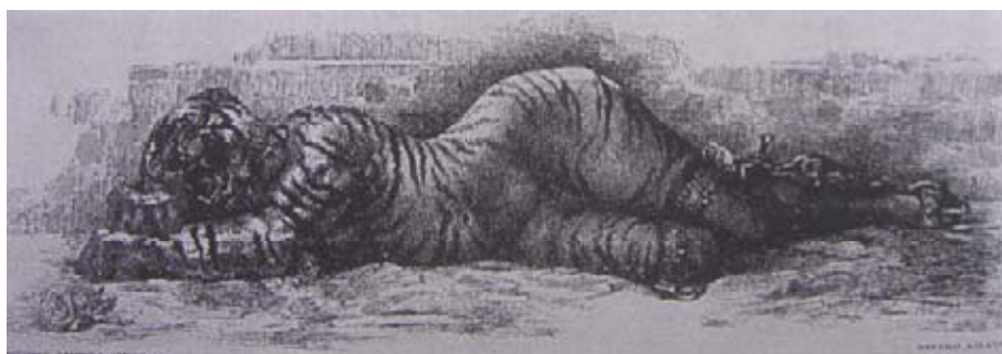
Severo Amador, La tigresa .

Ante tales construcciones, ya sean religiosas, o las provenientes de la moral y mojigatería burguesa, surgen extensas imágenes dentro del arte, fundamentalmente en la pintura, que dan cuenta, de la visión particular que diferencia a cada época, y por medio de las cuales encontramos que la mujer y el desnudo femenino, se convierten en el cuerpo adecuado para simbolizar aspectos relacionados al erotismo; como el placer, la lujuria, la voluptuosidad, el mal, lo diabólico; es decir; todo aquello que conlleva a los pecados de la carne y en los cuales la participación del sexo masculino, queda en la periferia, en calidad de víctima. Siendo notoria la responsabilidad imputada a la mujer, surgen diversos mitos, como el mito moderno de la femme fatale y otras tantas edificaciones en torno a éstos. En una obra de Severo Amador, titulada La tigresa , 59 encontramos la referencia iconográfica del desnudo femenino como trampa que seduce a través del sexo; pero que con su rostro felino, advierte gran peligrosidad.