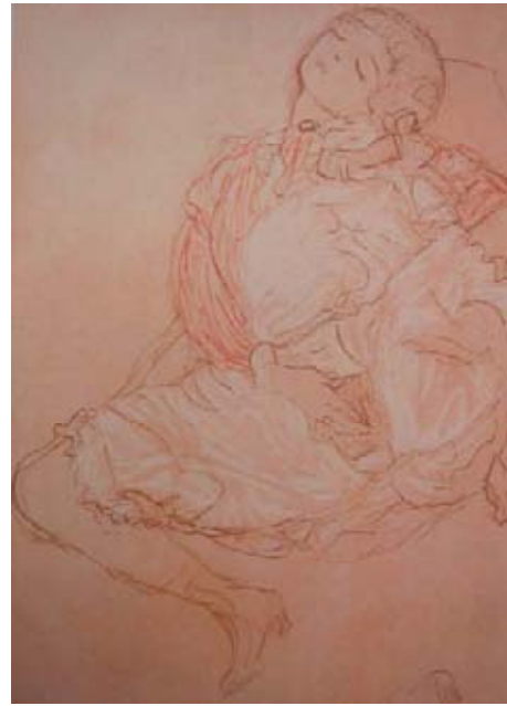
Gustav Klimt, Sitting Semi-nude , 1913.