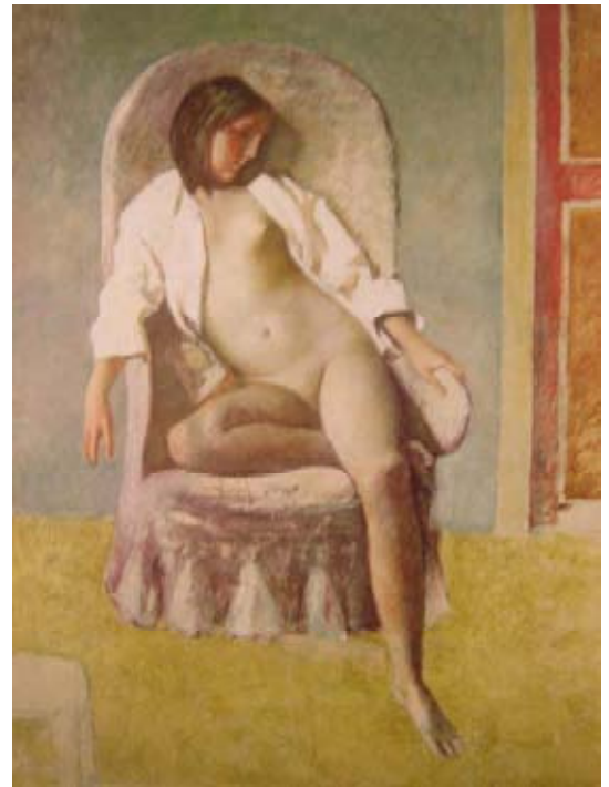
Balthus, Desnudo tumbado , 1977.