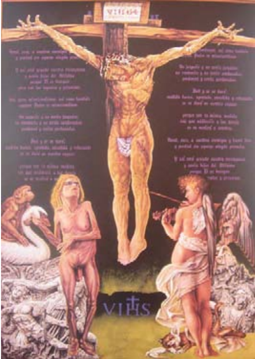
TDV, El Santo señor del sidario .

decir todavía, no hemos superado los principales interdictos; y estos, ya no sólo son los impuestos a la carne.