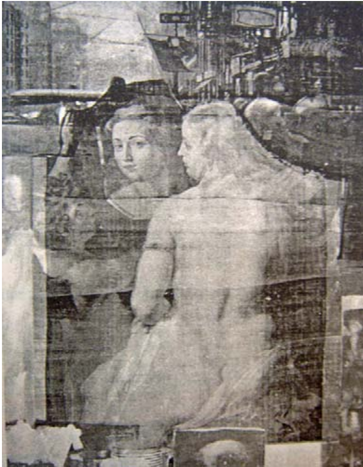
Robert Rauschenberg. Persimon . 1964. La obra apropiada es El baño de Venus de Rubens (1612-1615).

Otros ejemplos pueden aparecer en el escenario, pero toca ubicarnos en el concepto de apropiación, con la intención de definirlo, desglosarlo, asimilarlo como estrategia artística de resistencia y crítica, que dará sentido a la propuesta pictórica que como parte de esta investigación se propone.