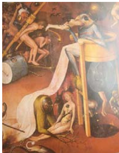
El Bosco, El infierno , fragmento.

La imagen del cuerpo desnudo se vincula al pudor, a la mentalidad predominante que diferencia una época de otra. La presencia del erotismo disfrazada o asumida, varía en las representaciones del cuerpo dentro del arte, como menciona Bataille, “ Si la Edad Media ha figurado la desnudez- es para que se le coja horror ”, los cuerpos que observamos dentro de algunas pinturas de este período, apiñados, son criaturas conscientes de su pecado, reflejan la culpa y son condenadas al infierno y a las tinieblas eternas, y la razón por la cual muestran su anatomía es el castigo divino, al que han sido destinadas, por haber caído en la tentación y cometer con el cuerpo lo que el cristianismo define como pecado.