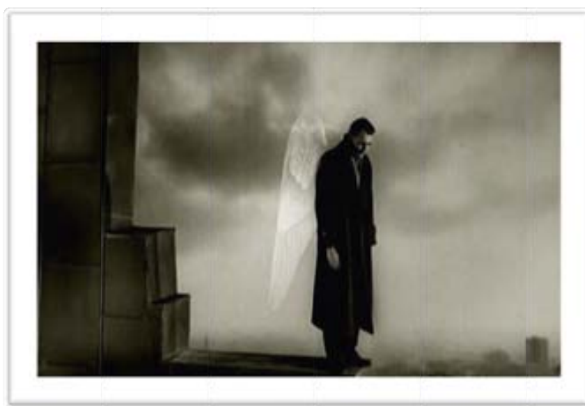
Ilustración 10 Disolución de las alas de Damiel, epifanía de su humanidad

La secuencia inicial toma-contratoma presenta la imagen de Damiel sobre una torre con su parte más alta en ruinas. Al ángel se le disuelven las alas (Ilustración10) , aquí el autor da el reconocimiento de que el ángel perderá sus alas durante la narración. Desde la mirada del ángel vemos a una niña que se detiene a media calle para observarlo, en las subsecuentes tomas, las niñas que viajan en el autobús y la pequeña dibujante en el avión, nos confirman que el personaje es invisible, excepto para los niños y los propios ángeles. En el caso de Peter Falk, él no los ve, pero los intuye, por ser un ex ángel.