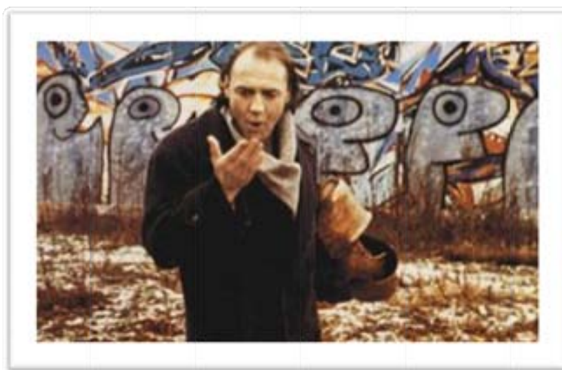
Ilustración 11 El asombro de Daniel hombre ante los sentidos

Incluso en la ficción romántica el personaje de Daniel nunca cae en el rol típico masculino líder en la relación. El ex ángel no actúa como el varón obsesionado con una mujer. Daniel permanece deseoso más bien de percibir y experimentar tanto como él pueda, a través de sus nuevos sentidos ganados.