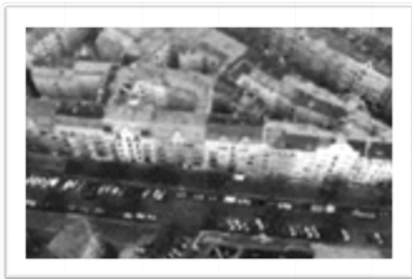
Ilustración 3 Berlín a través de los ojos de los ángeles