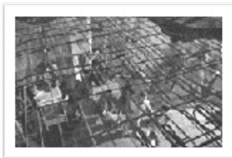
Ilustración 7 El set de grabación en el búnker nazi

El actor Peter Falk, que se interpreta a sí mismo, se desliza entre dos mundos: Berlín real en el presente, Berlín del pasado en el set , al participar en el rodaje de una película sobre la Alemania nazi. Aquí se muestra la capacidad del cine para evocar y dar una versión del pasado.