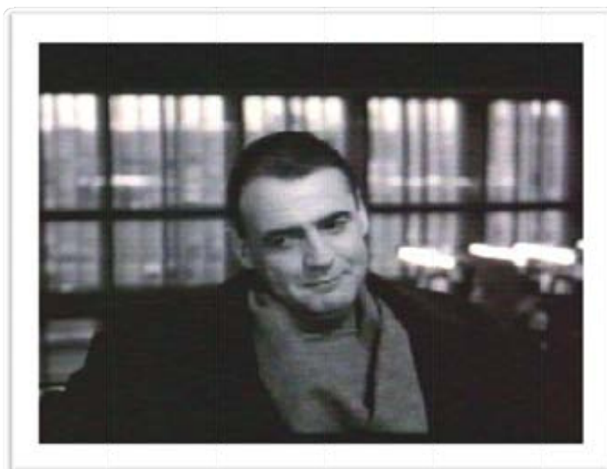
Ilustración 5 El ángel Daniel en la biblioteca

Este es el espacio de Daniel, Cassiel y Homero, aparece tempranamente en la película en la escena número seis “Ángeles en la biblioteca” y en la número 10 “Pensamientos para ir a la muerte”.