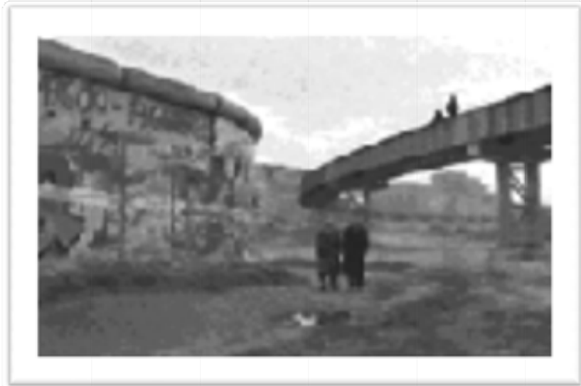
Ilustración 2 Homero y Cassiel junto al Muro de Berlín