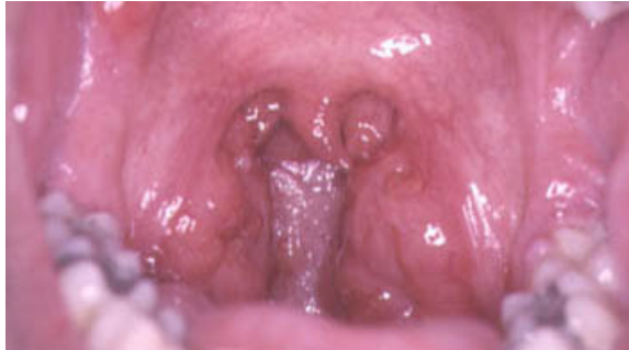
Fig.4. Faringitis gonorreica