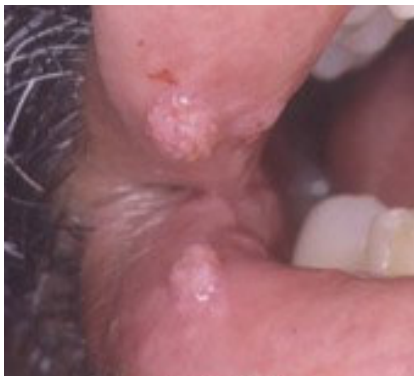
Fig. 2. Condiloma Acuminado en labio http://www.infocompu.com/adolfo_arthur/gonorrea.htm