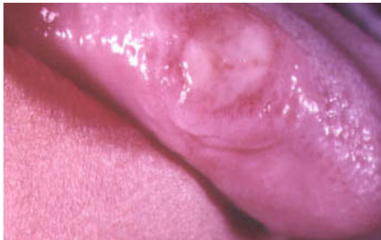
Fig. 5. Chancro en borde lateral de lengua

http://www.infocompu.com/adolfo_arthur/gonorrea.htm