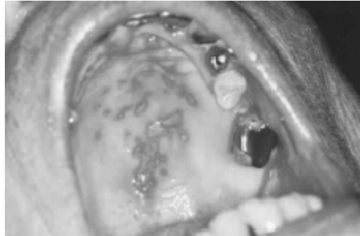
Fig. 1 Úlceras herpéticas en paladar duro, por práctica de fellatio http://www.uff.br/dst/revista14-2-2002/Jornal-dst-14-2-2002.pd