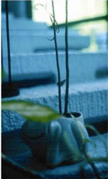
Ventanal, 2005 Diapositiva