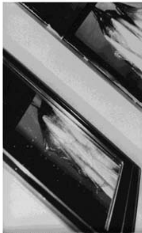
Círcel, 2005 Plata sobre gelatina sobre papel de fibra 6 1/2 x 4 1/2

La siguiente serie de fotos las tomé en blanco y negro, con rollo de 35 mm y ampliadas en papel de fibra. Trabajé fotografiando sus objetos como consecuencia de haber tomado conciencia de estas presencias en las diapositivas anteriores.