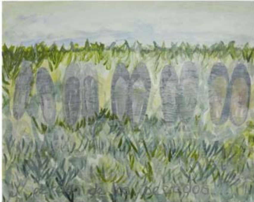
El perdón de los pecados, 2008 Impresión digital y acrílico sobre tela 50 x 40cm

"El Perdón de los Pecados" nombre del jardín donde está el cuerpo de mi mamá, es el lugar donde he puesto sus zapatos, para que "se vaya al cielo con..." los que ella decida. La hierba al igual que en las vanitas holandesas significa la corrupción del cuerpo. La composición es con un horizonte alto, la pintura es infantil.