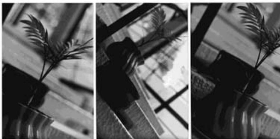
Escalera , 2005 Plata sobre gelatina sobre papel de fibra. Políptico con 3 módulos de 6 1/2 x 4 1/2 cm

El políptico de la escalera es una alegoría de nuestras vidas, me refiero a la simbiosis que tenía y que tal vez siga teniendo. ¿Soy yo o es ella?... aunque son situaciones diferentes, la distancia o mejor dicho, la cercanía entre las dos es siempre la misma, con la posibilidad de que se caiga ese equilibrio.