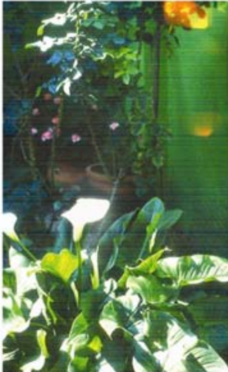
Jardín, 2005 Diapositiva