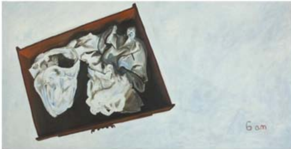
Su cajón, 2005 Óleo sobre tela 50 x 120cm

El cuadro "su cajón" surgió porque una prima me dijo que yo debía juntar su ropa, ponerla en un cajón y enterrarlo en la cabecera de la tumba. Esto es imposible en el panteón en el que mi mamá está enterrada. Entonces en un intento por llevar a cabo este consejo, pinté este cuadro. Es un cajón de su tocador con su ropa interior dentro, en un lugar abierto como simulacro del enterramiento a una hora aproximada a la desaparición de mi madre.