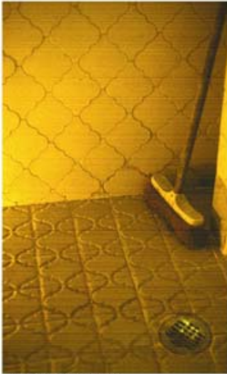
Baño, 2005 Diapositiva

El baño forma una escena con claras muestras del paso del tiempo. La composición dada por líneas ligeramente inclinadas, la verticalidad remarcada por la escoba con la que desde niña me enseñó mi madre a limpiarlo.