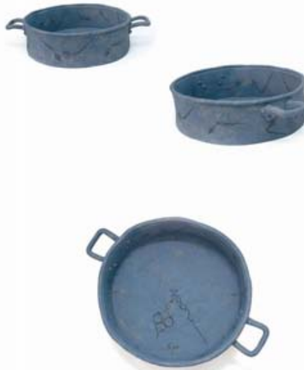
Cazuela, 2005 Cerámica con engobe 57 x 41 x 41cm

Con el propósito de homenajearla, reconociéndola como mujer, su forma de vida, tal como ella decidió vivirla y respetándola, elaboro las siguientes piezas. Trabajo las esculturas en cerámica, en estas ya no busco la aparición de lo ausente, ya no uso la obra como evocación sino como simulacro de la realidad. Es así como reproduzco una de sus cazuelas que ya no contiene comida, sino un tiempo que se detuvo a las seis veinte de la mañana.