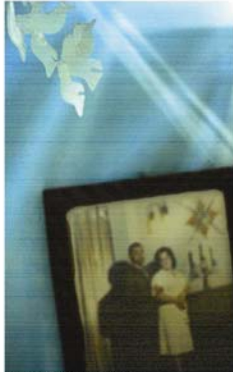
Escalera, 2005 Diapositiva

El jardín que misteriosamente* permaneció hermoso durante mucho tiempo sin que nadie lo pudiera atender ni consentir de la misma manera. El alcatraz floreció.