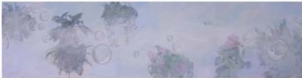
Su jardín , 2008 Impresión digital y acrílico sobre tela 120 x 35 cm

"Su Jardín" es en definitiva el cuadro que más me gusta, me alegra. Es un cuadro intimista como toda mi obra, que subraya el sentimiento de nostalgia. Las bombas de jabón representado la fragilidad del cuerpo, aunque reivindicando la existencia por la felicidad de la vida, de fondo las plantas que mi mamá cuidaba y que la hacían feliz, en esa atmosfera cíclica que corre y no termina, como un morir y renacer interminable.