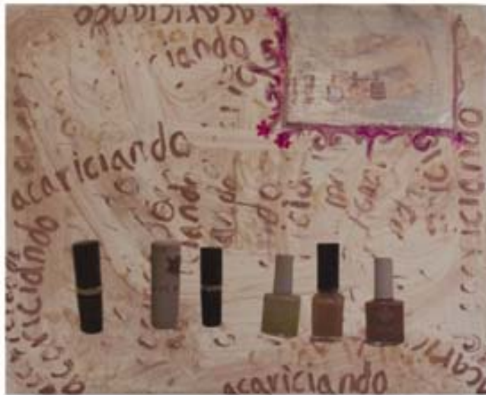
Barnices y labiales , 2008 Barniz de uñas e impresión digital sobre tela 50 x 40cm

Los barnices y labiales son el tema del cuadro realizado todo con barniz de uñas, que me recuerda sus manos y principalmente sus caricias como actitud ante la vida; al fondo un espejo, que en las vanitas simboliza que en la vida todo es apariencia, en esta ocasión pretende reflejar un abrazo de madre-hija.