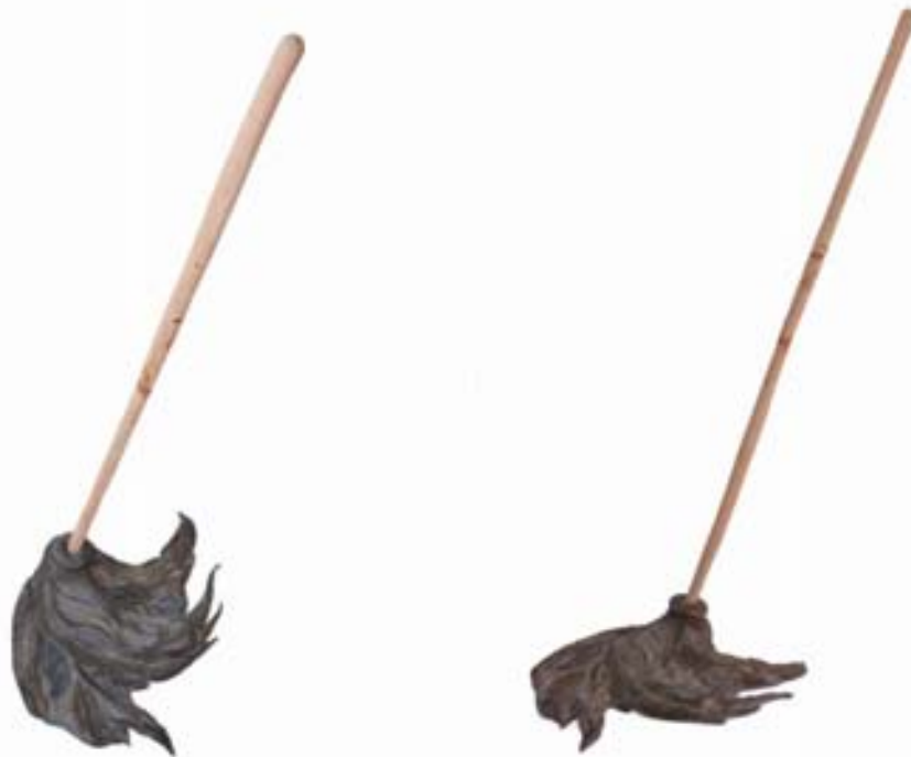
Mechudo , 2005 Cerámica con engobe 110 x 46.5 x 41cm

El mechudo es un instrumento de limpieza que utilizaba mucho y constantemente, el piso de mi casa siempre estaba limpio, por eso le di movimiento, parece haber sido congelado en acción. El palo que es también de barro se sostiene en el aire por el peso de la base.