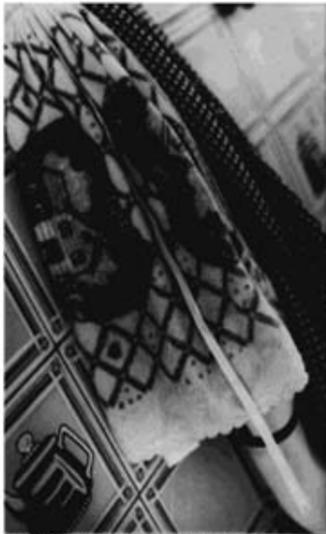
Secador, 2005 Plata sobre gelatina sobre papel de fibra 6 1/2 x 4 1/2