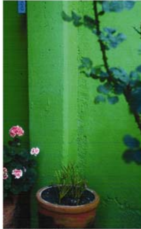
Jardin II, 2005 Diapositiva

El ventanal junto a la escalera que en otro tiempo estaba llena de macetas y macetitas con una gran variedad de plantas. En primer plano encontramos unas hojas verdes desenfocadas, que contrasta con lo seco y vertical de la planta en la macetita de rana feliz. La horizontal está dada por la sucesión de escalones que se esfuman al fondo.