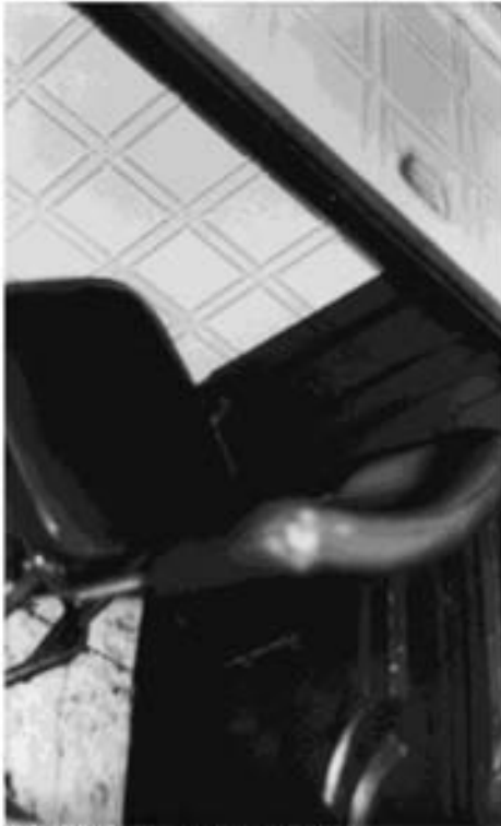
Silla, 2005 Plata sobre gelatina sobre papel de fibra 61/2 x 41/2