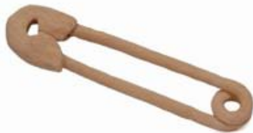
Seguro, 2005 Cerámica con engobe 3 x 34.5 x 8cm

Mi madre siempre traía un seguro en su ropa, algunas veces para sustituir el botón perdido, otras veces me parecía casi como amuleto.