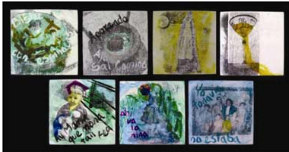
Cazuelita, molcajete sobre la silla, mandil y secador, copa de casados, niña con toga y birrete, junto al río, foto familiar, 2007 Xerografía y acrílico sobre mader. Políptico de 7 piezas de 15x15 cm c/u

La cazuelita y el guisado que solía preparar en ella. El molcajete sobre la silla con los ingredientes para el aporreado. El mandil y el secador. La copa de "Ella" cuando se casaron mis papas, sola. La muñequita con toga y birrete es un adorno que mi madre compro -como ya había mencionado- cuando ella iba a escuela a los sesenta y dos años; su medio de transporte en esa época era el trolebús por eso lo incluyo en la escena. La figurilla de la niña con canasta de frutas insertada en un camino junto al río, evocando la atmósfera de su vida en el rancho. Por último, la foto familiar de estudio en la que yo, la hija más chica, todavía no aparezco, pero sí está ella y mi hermano con parálisis cerebral.