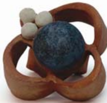
Arete , 2005 Cerámica con engobe 57 x 41 x 41cm

Un arete del par que utilizaba, lo reproduje en una proporción mucho mayor a la real. La construcción de la pieza fue a base de placas y churros. Son dos piezas, el cuerpo y la mariposa que puede separarse del poste. Me decidí por este objeto porque era el único accesorio símbolo de su coquetería.