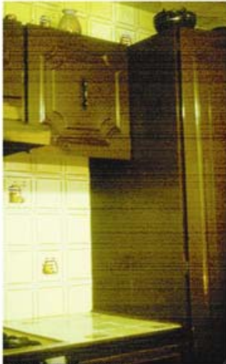
Cocina, 2005 Diapositiva