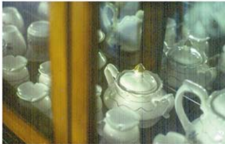
Comedor II, 2005 Diapositiva

El comedor representado por la vitrina. Una vertical separa al espectador de los juegos de té, estos se reflejan en el espejo. Es una atmósfera silenciosa, como tiempo encapsulado.