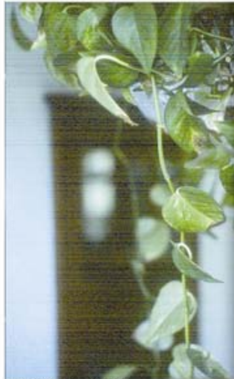
Sala, 2005 Diapositiva

La primera serie son diapositivas tomadas en cámara de 35 mm, con una luz amarilla, la de mi casa ayudada por otro foco en el piso, para bañar toda la escena con la misma luz. Fotografíe la cocina, donde ella era tan feliz, un lugar que casi nadie podía invadir, lo defendía más que su recámara. En la imagen la cocina está limpia, pero no limpia por su dedicación, si no por su ausencia. Líneas ligeramente inclinadas forman la perspectiva, elementos horizontales y verticales forman el mueble, lo pesado de este contrasta con lo vacío de la plancha. Los objetos están muy lejos, sólo son adorno.