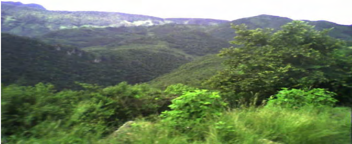
Foto2. Vista de la Sierra Gorda de Querétaro.

A pesar de que el turismo puede ser una importante actividad económica en el municipio de Jalpan de Serra, este cuenta con pocos restaurantes y lugares para hospedarse; además no se la ha dado el impulso necesario a este sector.