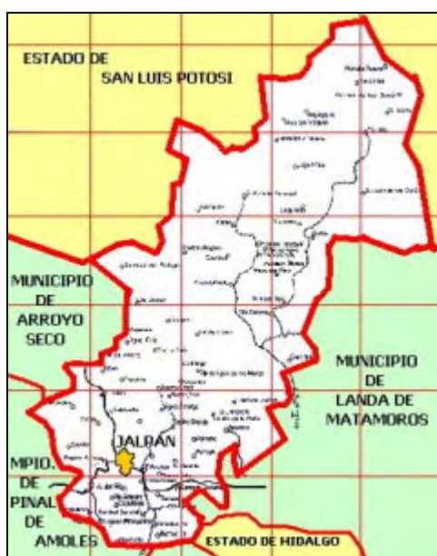
Mapa1. Ubicación geográfica del municipio de Jalpan de Serra. 5

La ganadería se desarrolla principalmente en agostadero; en lugares cercanos a la Cabecera Municipal. Hay 13 167 cabezas de ganado bovino; 6 392 porcinos; 1 780 ovinos; 650 caprinos y 2 080 equinos. También hay 24 880 aves de traspatio. Además, se cuenta con bordos para abrevadero en Valle Verde, San Antonio Tancoyol, Las Flores, Petzcola, San Vicente Ferrer, El Saucillo y Tancáma. Sin embargo esta actividad pierde importancia comparada con el estado, ya que Querétaro es uno de los tres principales productores de leche a nivel nacional, con un volumen diario estimado en más de un millón de litros. En Querétaro se procesa el cincuenta por ciento del lácteo en varias plantas, algunas de ellas modernas y bien equipadas con tecnología de punta; las hay semitecnificadas y otras de carácter artesanal, pero todas con productos de excelente calidad, como quesos de todo tipo, yogurt, cremas, mantequillas, cajetas y dulces. 4