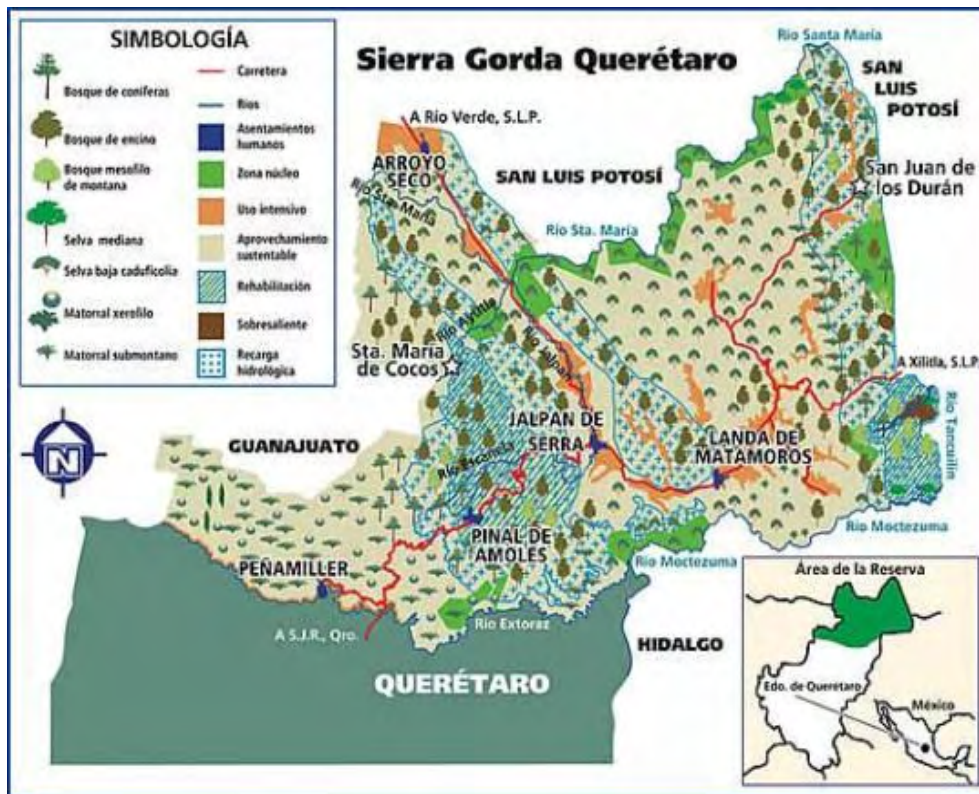
Mapa 1. La Sierra Gorda de Querétaro. 2

Jalpan de Serra para el 2000 tenía 22 839 habitantes, de los cuales 10 898 eran hombres (47.7 %) y 11 941 eran mujeres (52.3 %). Para el 2005 presentó una reducción en su población de 1.6%, lo que significa que quedaron 22 025, de los cuales el 47.6 % son hombres y el 52.4% mujeres.