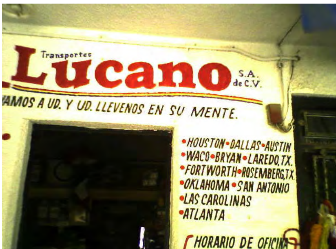
Foto 4. Vista de la tienda de donde sale la camioneta que transporta a los habitantes de Jalpan hacia Estados Unidos.

También existe un lugar en donde se encargan de llevar a la gente a EUA, esta es una tienda cercana al centro del municipio, una persona nos comentó que los llevaban al municipio de Río Verde ubicado en San Luís Potosí, y que les cobraban aproximadamente 14 mil pesos por llevarlos a EUA.