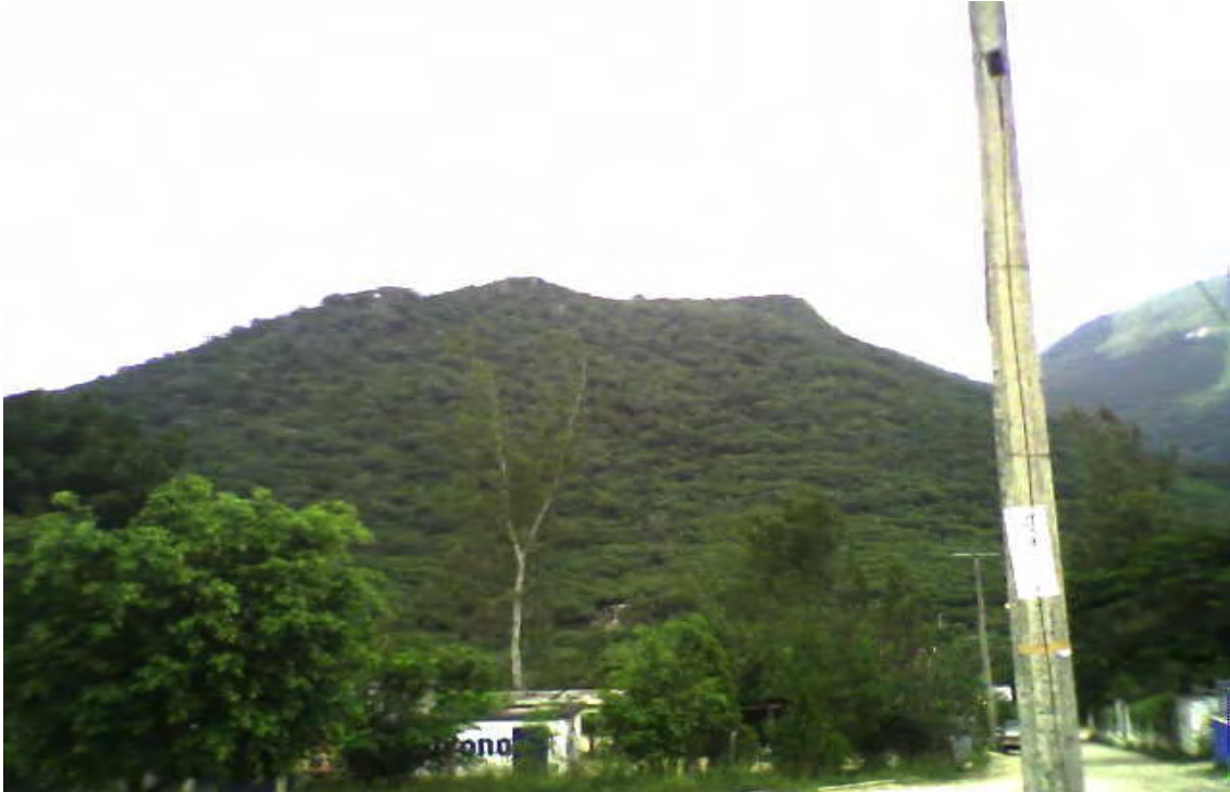
Foto 3. Vista de las localidades de Jalpan de Serra.

El municipio de Jalpan de Serra, en Querétaro, resume muy bien el panorama de la migración de mexicanos hacia Estados Unidos y su repercusión en la educación: por lo menos, 900 estudiantes de los que estaban inscritos en escuelas de la Sierra Gorda de Querétaro se han dado de baja para seguir los pasos de sus padres, quienes también dejaron el país. 3