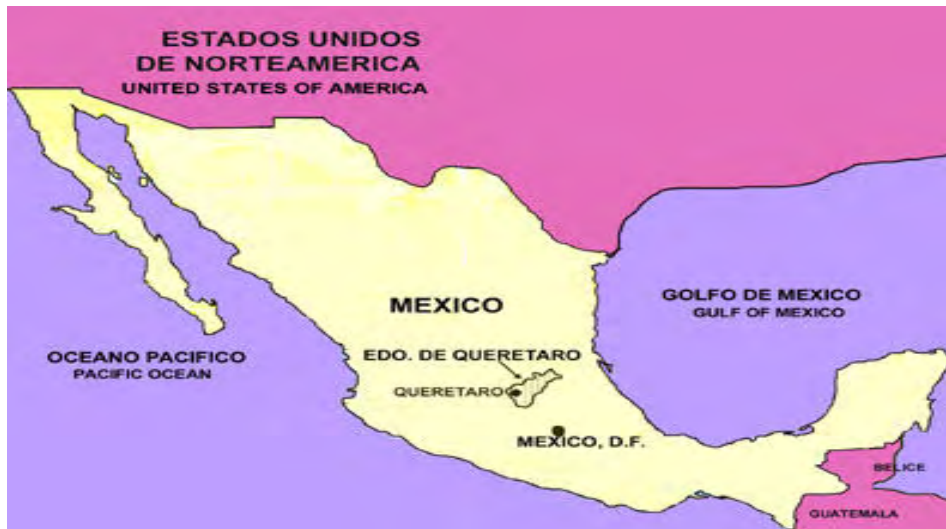
Mapa3. Distancia de Querétaro respecto a EUA. 1

El movimiento migratorio en Jalpan puede rastrearse desde mediados del Siglo XX. Cuando algunos jalpanenses en busca de contratos temporales se fueron a EUA, y lograron su permanencia; pero en la actualidad, la creciente migración juvenil se enfrenta a una estancia ilegal que implica problemas de diversa índole. (Instituto Nacional para el Federalismo y el Desarrollo Municipal Gobierno del Estado de Querétaro, op cit ).