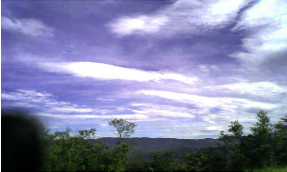
Foto1. Vista de las afueras del municipio de Jalpan de Serra.

Seguramente esta tendencia a la baja se debe a la alta participación de la población de Jalpan de Serra en el fenómeno migratorio entre México y Estados Unidos.