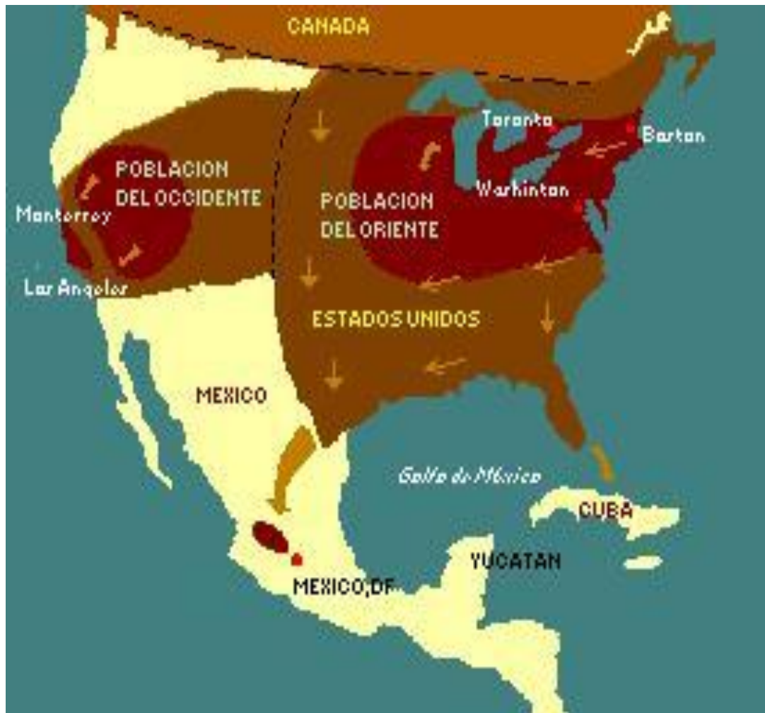
Figura 1. Mapa de las rutas migratorias de la Mariposa Monarca.