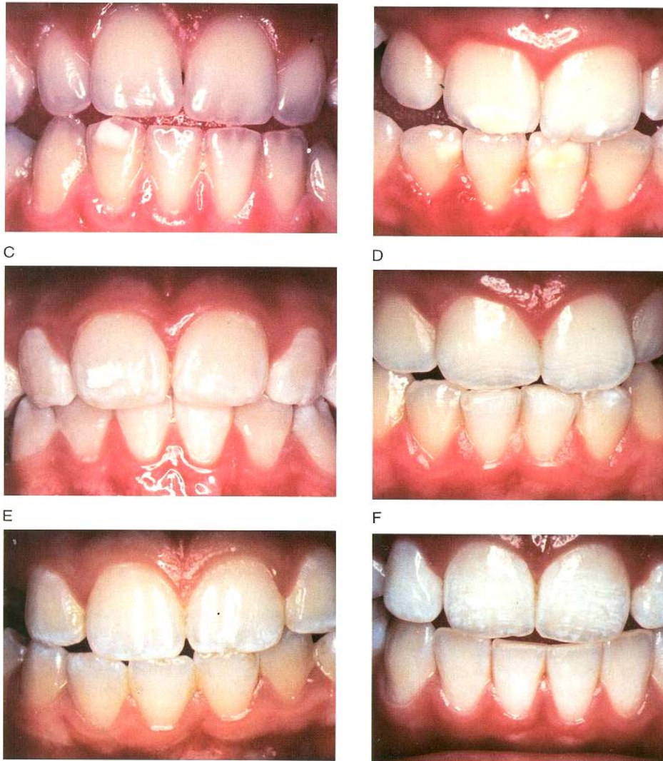
Lámina 2. Ejemplos de codificación de opacidades e hipoplasia del esmalte A: primer incisivo derecho superior-normal (clave 0), segundo incisivo izquierdo inferior opacidad delimitada (clave 1); B: primer incisivo derecho superior-opacidad delimitada (clave 1), primer incisivo izquierdo superior-opacidad delimitada e hipoplasia (clave 1); C: primer incisivo derecho superior-opacidad difusa (clave 2), primer incisivo izquierdo superior-opacidades delimitada y difusa (clave 5); D: primeros incisivos superior opacidad difusa (clave 2); E: primeros incisivos superiores-opacidad difusa (clave 2); F: primeros incisivos superiores-opacidad difusa (clave 2)