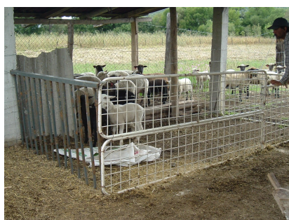
Figura 2: Adaptación de trampa para corderos