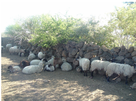
Figura 4: Tipo de instalaciones