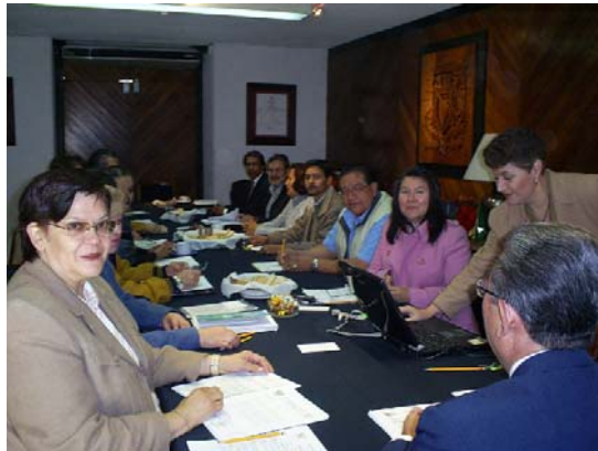
H. Consejo Técnico del periodo 2006-2012 de la FES Iztacala

Con estas modificaciones se hace saber también, que 18 días después de haber sido aprobadas, los Consejos Técnicos de cada una de las Escuelas y Facultades deben realizar un diagnóstico de los planes de estudio, con la finalidad de identificar aquellos que deban ser modificados.