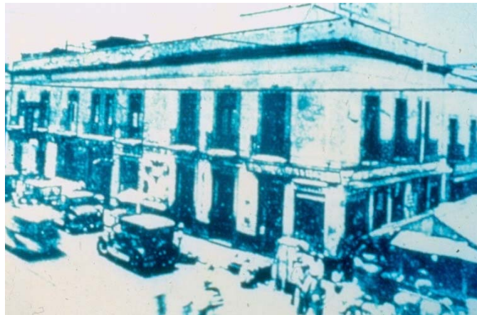
Consultorio Nacional de Enseñanza Dental

El 19 de abril fue inaugurada la escuela, que llevó el nombre de “Consultorio Nacional de Enseñanza Dental” anexo a la Escuela Nacional de Medicina, situado en la calle de la Escondida No 1 y 2 (actualmente es un edificio de departamentos en la esquina de Ayuntamiento y Eje Central), aquí permaneció hasta 1911, año en el que se traslada la escuela a la 3ª calle de Mina No. 30.