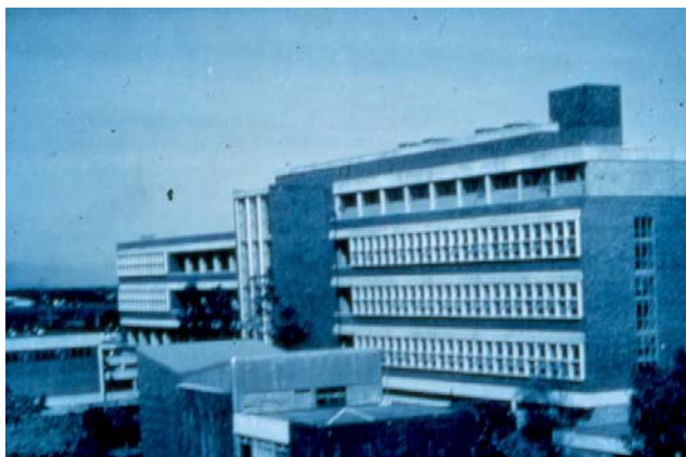
Escuela de Odontología, ahora Facultad de Odontología

recientemente creada Universidad Nacional de México, recibiendo el nombre de Facultad de Odontología. En abril de 1916, el Ministerio de Instrucción Pública dispuso trasladar la escuela a la calle de Licenciado Primo Verdad No. 3, en noviembre del mismo año se cambió a República de Brasil 35, a un costado de la Escuela de Medicina, en la antigua casa de los inquisidores, aquí permaneció por veinte años, en 1935 ante las necesidades de la escuela, fue necesario trasladarla el año siguiente en República de Guatemala y Licenciado de Primo Verdad No 2, donde permaneció hasta el año de 1954 en el que se muda a su actual sede , en un edificio construido ex profeso en la Ciudad Universitaria. Cuando se conforma el cambio de ubicación, también se confirmo el nombre de “Escuela de Odontología”, suprimiendo el de “Facultad de Odontología”, pero esto no se llevo a la práctica cotidiana, puesto que le seguía nombrando como Facultad, hasta que en 1945 se establecieron las condiciones necesarias para que una escuela pudiera recibir el nombre de facultad, estos requisitos nos los cumplía el plan de estudios de la carrera, así que tuvieron que pasar treinta años para lograr el anhelo de volver a ser Facultad de Odontología.