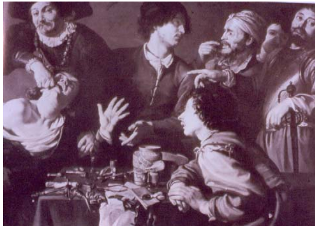
Fotografía de la práctica dental del siglo XIX

Se sabe que los barberos además de cortar el cabello de sus clientes, realizaban extracciones y sangrías, sin embargo no contaban con el instrumental idóneo para llevarlas a cabo. Por otro lado los merolicos se hacían acompañar de una banda musical que interpretaba escandalosas melodías por las principales calles y plazas, mientras el merolico realizaba la extracción la banda tocaba y uno de sus ayudantes disparaba una pistola cargada, cuyo estruendo provocaba tal susto en el paciente que no recordará el dolor.