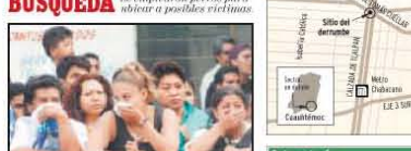
RIESGO Pese a la fuga de gas, los vecinos no se retiraron del área.