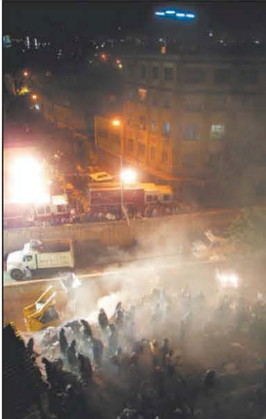
REMOCIÓN A partir de las 22:00 horas entró la maquinaria pesada a retirar los escombros del inmueble desplomado.

Algunos de ellos argumentan que les ha costado 15 años de esfuerzo hacerse