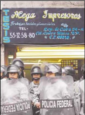
Elementos de la Policía Federal Preventiva resguardan las imprentas cuando luego de decomisar los documentos apócrifos.