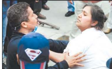
INCERTIDUMBRE Esta persona intenta llegar al sitio del desplome en busca de su familiar.