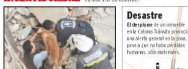
BUSQUEDA Se emplearon perros para ubicar a posibles víctimas.