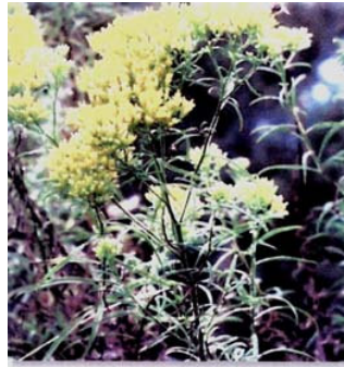
Figura 3. Gymnosperma glutinosum (Spreng.) Less