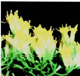
Figura 5. Conjuntos corimbiformes terminales de la inflorescencia de G. glutinosum .

Es una especie de hábito terrestre (Yu et al., 1988) y se encuentra asociada a bosques de encino, de pino, mixto de encino-pino y pino-encino (Argueta et al., 1994), matorrales y pastizales, de preferencia en áreas perturbadas y en la vegetación secundaria (Rzendowski, 1985). Se distribuye a lo largo del Valle de México, Guatemala y de Arizona a Texas (Rzendowski, 1985) y es utilizada en el estado de Durango, México, Puebla, Guanajuato, Guerrero (Argueta et al., 1994), Zacatecas y Nuevo León (Argueta, 1994).