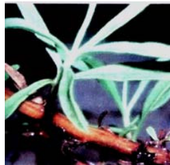
Figura 4. Hojas y tallo de G. glutinosum .