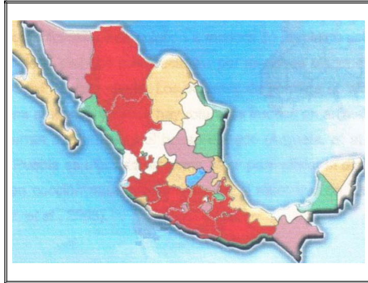
Figura 1. Distribución de Gymnosperma glutinosum ■

Una de las especies de la familia Asteraceae con gran distribución en nuestro país (Fig. 1), y utilizada como medicinal en varias localidades de nuestro país (Canales et al., 2005) y con actividad antibacteriana demostrada es Gymnosperma glutinosum (Spreng) Less. De acuerdo con Canales y col. (2006) algunas de las sustancias químicas que se encuentran presentes en la especie tienen un efecto antimicrobiano.