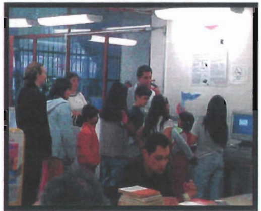
BIBLIOTECA “PARQUE ESPAÑA”

Se indica la manera en que esta ordenado el acervo.