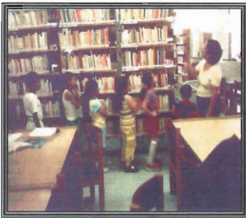
BIBLIOTECA “AMADO NERVO”

Generalmente esta actividad se realiza en un tiempo de 30 a 45 minutos, y al final se hace alguna actividad complementaria que tenga que ver con la lectura o con la consulta del acervo.