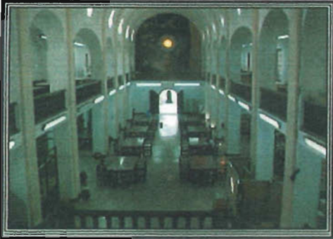
Sala de consulta