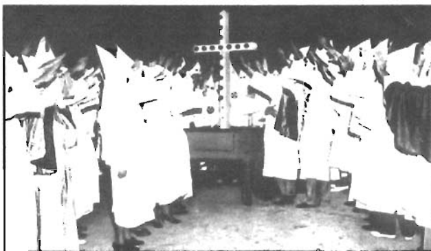
Ku Klux Klan. Ceremonia de iniciación (1954).