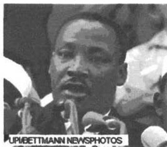
Martin Luther King

Martin Luther King se erigió como líder del movimiento en favor de los derechos civiles de las minorías, tras organizar el famoso boicoteo al transporte público en Montgomery (Alabama) en 1955. Luchó por un trato igualitario y mejoró la situación de la comunidad negra mediante protestas pacíficas y enérgicos discursos sobre la necesidad de erradicar la desigualdad racial institucional. En 1963 encabezó una marcha pacífica desde el Washington Monument hasta el Lincoln Memorial, donde pronunció su discurso más famoso: "Tengo un sueño".