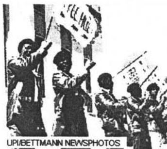
Miembros de los Panteras Negras

revuelta armada, manteniendo su facción en el exilio hasta 1975. En 1978 el grupo original se disolvió. 149