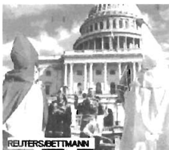
El Ku Klux Klan

En esta imagen aparece un portavoz del Ku Klux Klan, una organización secreta terrorista que se constituyó en 1865, dirigiendo un discurso a un grupo de seguidores frente al Capitolio de Estados Unidos en 1990. Los miembros del Ku Klux Klan y sus filiales creen en la superioridad de la raza blanca y luchan contra el progreso de los negros, católicos, judíos y otros colectivos. Sus militantes llevan túnicas y capuchones cuando se manifiestan públicamente.