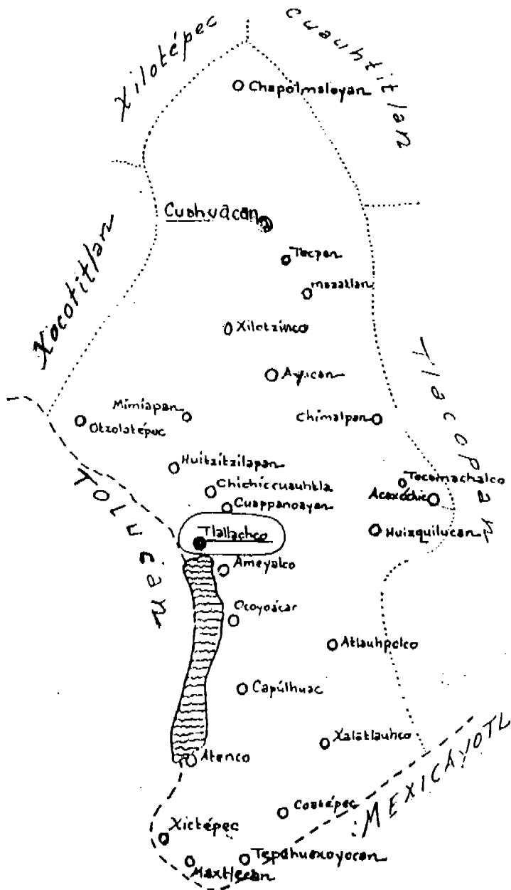
Mapa: La provincia tributaria de Cuahuacán.