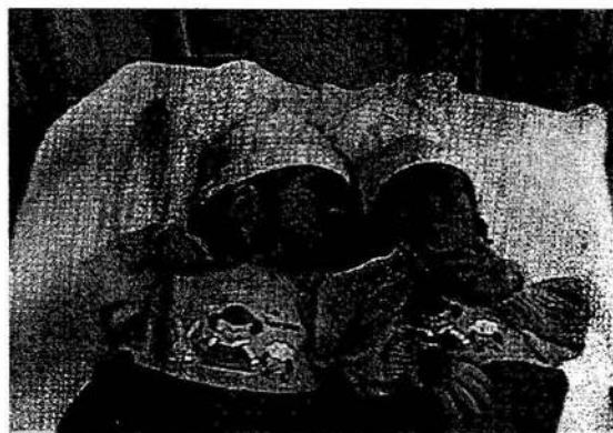
Foto 7. Independizacion organica total exitosa.