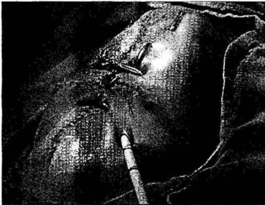
Foto 5. Aspecto postquirúrgico final de gemela II