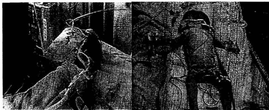
Foto 6. Evolucion postquirurgica en Terapia Izquierda gemela I, Derecha Gemela II