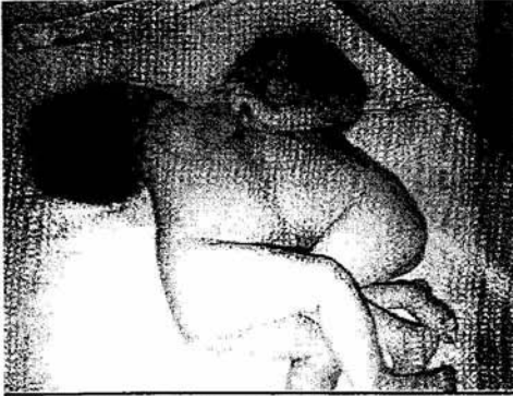
Foto.1 Gemelas Unidas Toracoonfalopagos