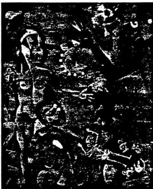
Gastón De Gyves (Oaxaca): "El cuentero". Oleo. Arena sobre tela. 100 X 150 cms. (Fragmento).

ha tenido reconocimientos y empiezan a llegar solicitudes de varias partes del mundo pidiendo características arquitectónicas y museográficas de esta galería. Esperamos que pronto podamos hacer exposiciones de artistas invitados, pero también ver la posibilidad de enviar nosotros artistas mexicanos.