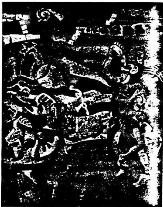
Gastón De Gyves (Oaxaca): "Los bebedores". Técnica mixta sobre tela. 100 X 120 cms. (Fragmento).

-Nosotros hemos tenido mucho éxito en la comunidad plástica nacional y con pintores extranjeros, porque nos abrimos a todas las corrientes y tendencias, aunque sí manejamos una política de exigencia como el hecho de que el artista tenga un alto contenido conceptual y técnico en su obra. Esto ha repercutido en que la galería mantenga un nivel muy alto. Aquí no hacemos prácticamente exposiciones individuales, hacemos exposiciones muy grandes que vienen a ser de hecho las exposi-