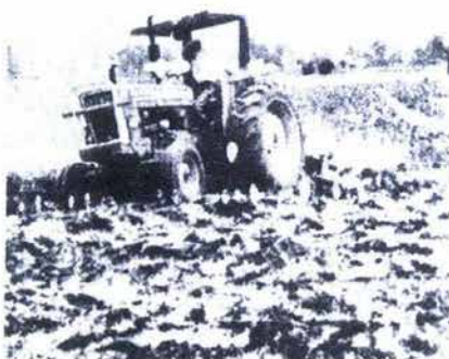
FIG. 9. Tractor utilizado en el campo.

de día y de noche; con el aire se reventaba la piel porque tardábamos ocho días en el agua. En la noche la ponía el velador y se repartía el agua de riego parejo". (Véase Fig. 9)