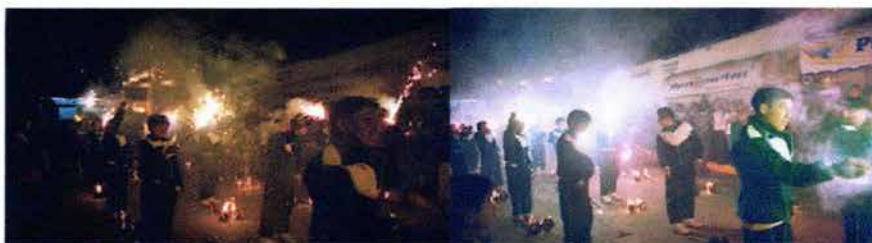
Fig. 24. Desfile de antorchas realizado el 15 de septiembre de 2002 por ola noche.

La noche del 15 de septiembre la gente se aglomera en los alrededores del Palacio Municipal, es tiempo del denominado "Desfile de antorchas" que realizan algunas escuelas representando la opresión que se tuvo durante el colonialismo. Da inicio con movimientos aeróbicos y rítmicos de alumnos que además permanecen en silencio por instantes hasta que encienden sus antorchas representando el paso próximo a la libertad. (Véase Fig. 24).