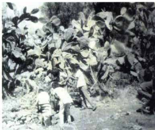
Fig. 8. Vegetación de la zona, espinas y cardones.

En el campo, mi mamá me platicaba que se lastimaba las manos jalando las espinas y quemándolas para que pudieran sembrar. (Véase Fig. 8)