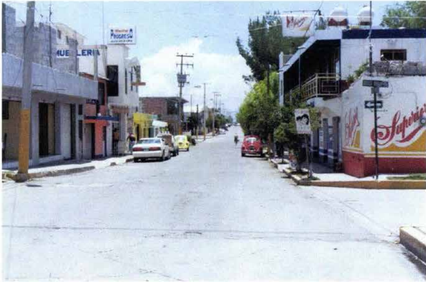
Fig. 15. Avenida 16 de septiembre.