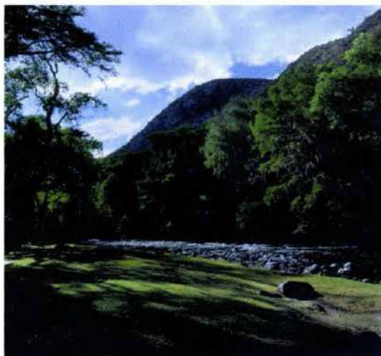
Fig. 22. El río en Progreso de Álvaro Obregón.

En primera instancia, se observan dos albercas pequeñas, maltratadas por el tiempo y, a un costado, se encuentran las recién construidas. El agua fluye del interior del cerro, es caliente y la utilizan tanto para lavar como para bañarse y beber. (Véase Fig. 22).