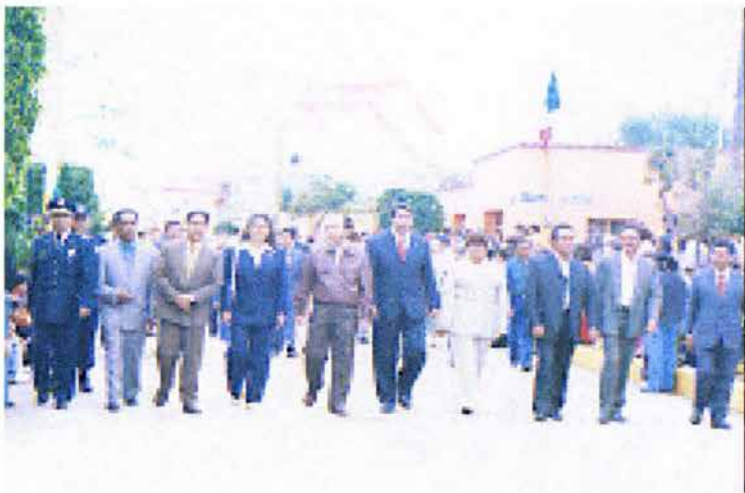
Fig. 25. Contingente de autoridades en el desfile (septiembre de 2002).

Una vez que da inicio el evento, encabeza el desfile el contingente de autoridades de Progreso de Álvaro Obregón; algunos vistiendo ropas sencillas y otros un poco más formales. Durante su recorrido, todos ellos son recibidos con grandes aplausos expedidos por los habitantes que están a la expectativa y que dará inicio al despliegue de los participantes. (Véase Fig. 25).