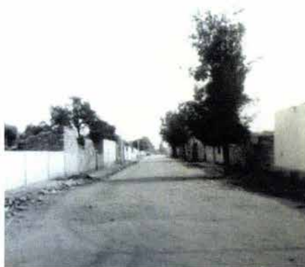
Fig. 7. Calle principal de Progreso de Álvaro Obregón aún sin pavimentar.

La gente marcaba su lindero con espinas y cardones, en lugar de cercas; no había calles pavimentadas y existían pocas tiendas. (Véase Fig. 7).