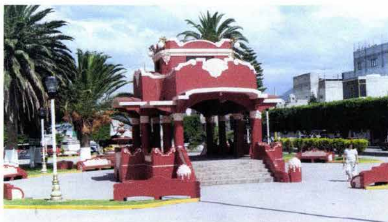
Fig. 18. Kiosco ubicado frente a la Presidencia Municipal.

Progreso se ha desarrollado por el continuo interés de sus autoridades y habitantes. Una de las primeras obras producto del interés del gobernador del estado fue la construcción de la carretera Actopan-Tula. En fechas posteriores: la pavimentación de calles, avenidas y banquetas; la construcción de edificios de interés social (dos bibliotecas, el Palacio Municipal, el DIF, el teatro, la bajada del río, la rehabilitación de instalaciones educativas, de bancas y kiosco del municipio). (Véase Fig. 18).