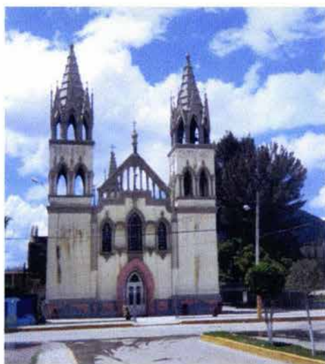
Fig. 20. Iglesia del Sagrado Corazón de Jesús.

Por otra parte, en la Iglesia del Sagrado Corazón de Jesús, se ha iniciado un proyecto de ampliación debido a que la comunidad católica ha aumentado considerablemente. (Véase Fig. 20).