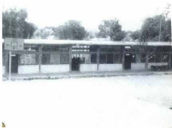
Fig. 14. Escuela Primaria Margarita Maza de Juárez.

Todos colaboramos en el arreglo de la escuela, hombres y mujeres. Entregué seis aulas tapadas, me faltaban aplanados, pisos, puertas y ventanas. Hice dos aulas más y una bodega para artículos otorgados por el IMPI. (Véase Fig. 14)