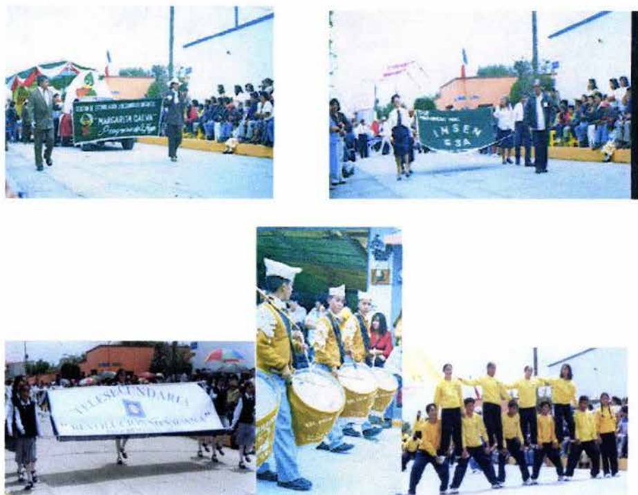
Fig. 26. Algunas instituciones y organizaciones Participantes en el desfile del 16 de septiembre del 2002.

Le siguen un grupo representativo de cada escuela, organización política, social y religiosa. Entre este último están: la comunidad evangélica Philadelphia, la Iglesia Sinaí, Pentecostés, Testigos de Jehová, Séptimo Alegría, Ángel de la Luz y espirituistas. Además participan: el DIF, el Albergue para Migrantes, escuelas materno-infantiles, etcétera. (Véase Fig. 26).