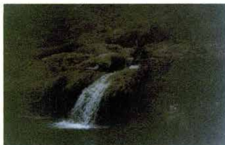
Fig. 23. Cascada "El Ojito" en el municipio.

se encuentra a escasos 50 metros. Se llama "El Ojito" y con frecuencia es visitado porque su agua se origina de las paredes del cerro y es totalmente transparente, se trata de una pequeña cascada. (Véase Fig. 23).