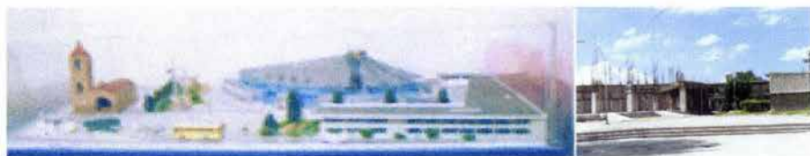
Fig. 21. Proyecto de ampliación de la iglesia y avances de la misma.