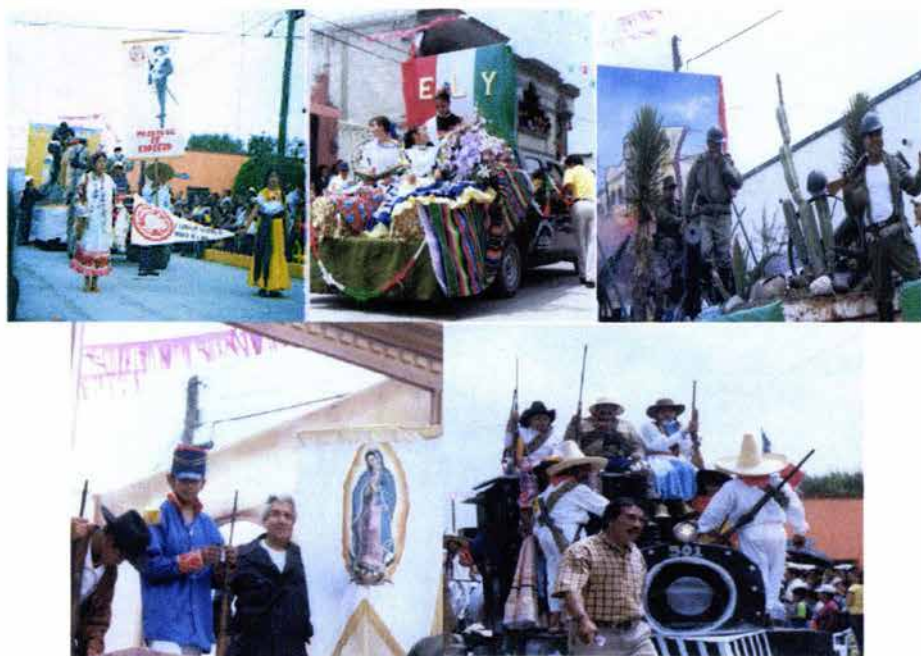
Fig. 27. Representación de la lucha por la Independencia de México a bordo de carros alegóricos.

También son importantes los carros alegóricos, que en ocasiones el adorno es realizado por los mismos habitantes de Progreso. En ellos representan situaciones referentes a la Independencia de México, pero también dan a conocer reinas elegidas en diversos ámbitos como: de las fiestas patrias, del pueblo, de las escaramusas. (Véase Fig. 27).