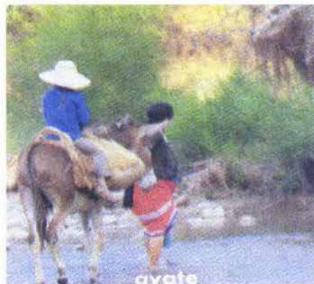
Fig. 10. El uso del ayate.

de madera o de maíz recogían la mercancía en el monte. (Véase Fig. 10).