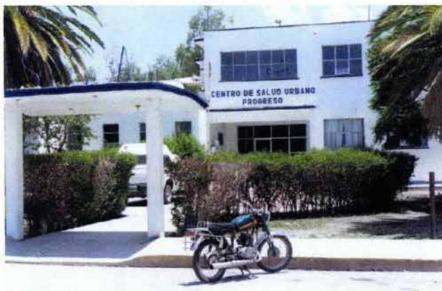
Fig. 16. Centro de Salud Urbano Progreso, antes Hospital Ejidal.

El Sistema de Salud, dentro del municipio, es supervisado por representantes de la Secretaría de Salud, con la finalidad de otorgar de seguridad social a quienes no cuentan con este servicio y lograrlo de manera óptima, con calidad y en forma oportuna a través de la coordinación médica municipal, con la finalidad de unir esfuerzos en beneficio de la población de menos recursos. (Véase Fig. 16).