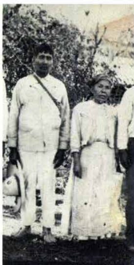
Fig. 6. Vestimenta de los pobladores de Progreso de Álvaro Obregón.

Había mucha pobreza, la gente vestía un calzoncito (comúnmente llamado así al pantalón de manta), camisa de manta y huaraches de suela porque no alcanzaba para zapatos; las mujeres, vestido largo, mandil y huaraches. (Véase fig. 6).