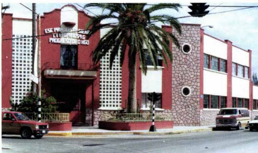
Fig. 19. Escuela Primaria "Justo Sierra", la primera y la más grande del estado de Hidalgo.

Progreso tiene una situación geográfica envidiable lo cual ha traído como consecuencia la apertura de escuelas particulares y de gobierno. El nivel educativo abarca: preescolar, primaria, secundaria, 2 telesecundarias, una secundaria técnica, una Normal Superior (de la cual es propietaria gente de México) y la Normal Superior del Valle del Mezquital.