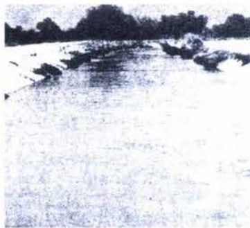
Fig. 12. El Gran Canal de Desagüe del Valle de México.