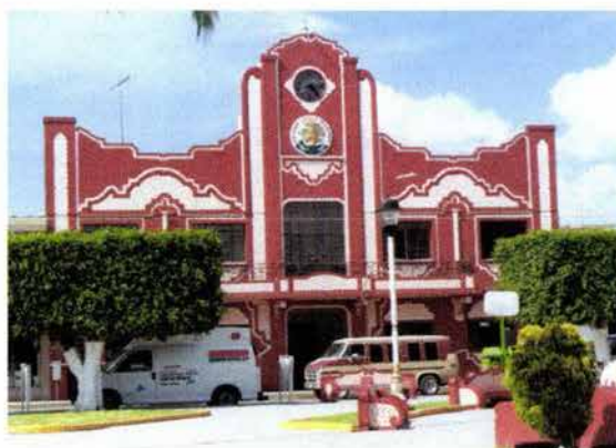
Fig. 17. Palacio Municipal de Progreso de Álvaro Obregón.