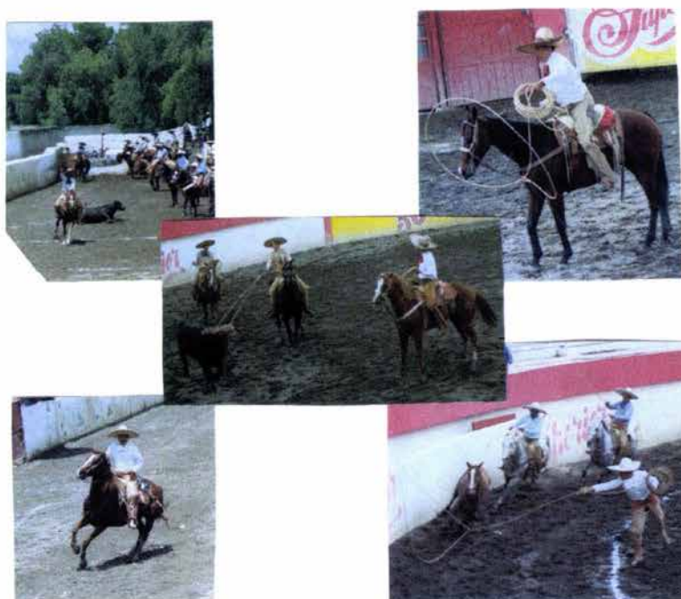
Fig. 29. Charros ejecutando diversas suertes

indígena, en manta y con colores llamativos. Utilizan una pluma en la cabeza y van descalzas. (Véase Fig. 29).