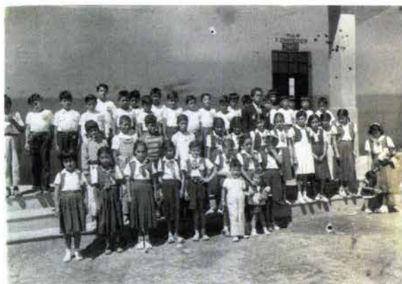
Fig. 11. Alumnos de la escuela Justo Sierra.