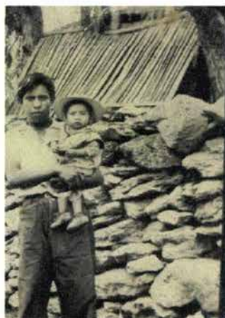
Fig. 4. Casa techada con tejamanil

Me daba mucho gusto la sonadera en la penca de maguey, no había casas decoradas como ahora y de cama teníamos un petatito, un costalito. Después, las casas comenzaron a construirse con piedra y lodo, abajo de ellas hay arena y grava. Se techaba con teja y tejamanil que era una especie de madera muy delgadita que no se rompía fácil, impermeable, parecía concreto. No se colaba ni el polvo. Generalmente era traída de Villa del Carbón. (Véase fig. 4 y 5).