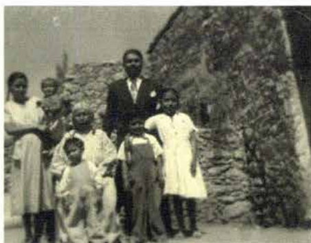
Fig. 5. Casa hecha de lodo y piedra