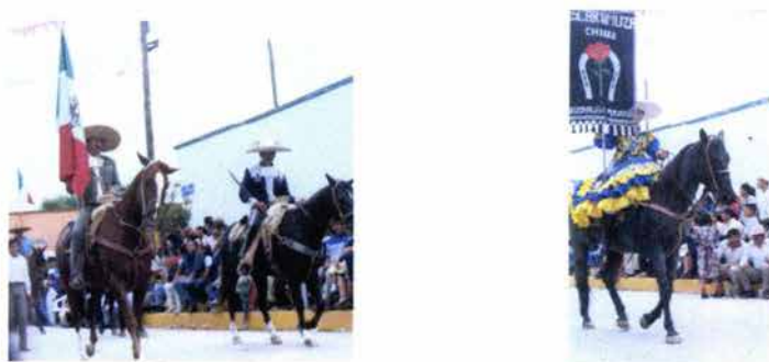
Fig. 28. Charros y escaramuzas participantes.

Varias asociaciones de charros y escaramuzas cierran con broche de oro dicho evento. En él se exhiben tanto los caballos como la vestimenta típica de los charros. Participa gente de todas las edades. (Véase Fig. 28).