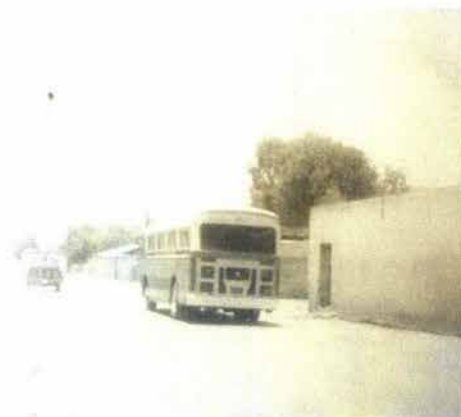
Fig. 13. Medio de transporte en la zona.

En 1944 se constituyó la Cooperativa Limitada de Autotransportistas del Mezquital (constituida por trabajadores del ferrocarril), dando origen formalmente al transporte de pasajeros y estableciendo la ruta que sigue más o menos el trazo del ferrocarril; después la carretera Progreso- México, vía Tlaxcoapan-Atitalaquia, Apazco, etc. (Véase Fig. 13)