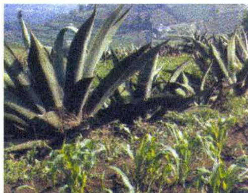
Fig. 3. Maguey que se cultiva en la región.