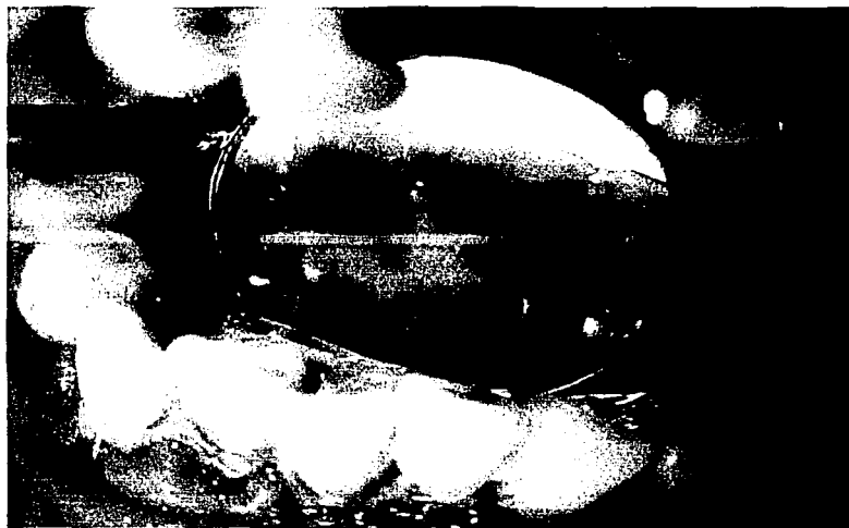
Foto 8. Paciente con estado crónico esquizofreniforme con deterioro periodontal evidente y formación de cálculo dental con hiperpigmentación. Fuente directa.