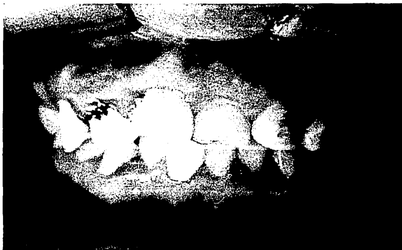
Foto 7 .Paciente con lesión periodontal severa, localizada en la papila del 12 que de forma espontánea sangra y se asocia al consumo de sales de litio y haldol.