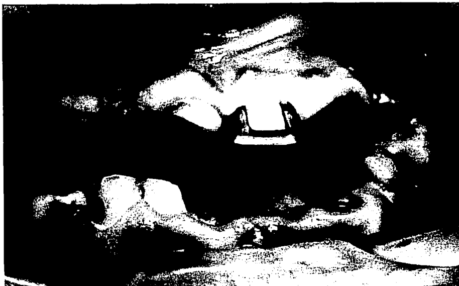
Foto.1. Paciente masculino de 41 años donde podemos apreciar las condiciones bucales generales con que llegan a la consulta odontológica. Además se observan pigmentaciones por melanosis racial.

Un solo paciente de sexo femenino no presentó patología en sus tejidos blandos, en consecuencia, 15 hombres y 4 mujeres si presentaron lesiones, correspondiendo al 95% de la población estudiada.