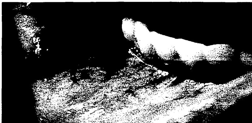
Foto 5. Lesión ulcerativa por trauma conocido (debido a mordedura facticia) en cicatrización luego de 1 semana de evolución.