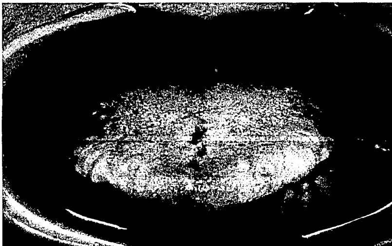
Foto 3. Paciente con lesiones por mordedura crónica en los bordes laterales de la lengua.