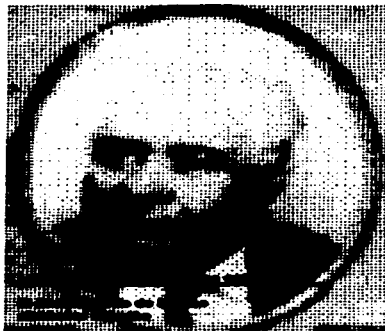
Consejo Nacional Técnico de la Educación

Vol. IV, No. 21. Septiembre / octubre de 1976 3ª época.