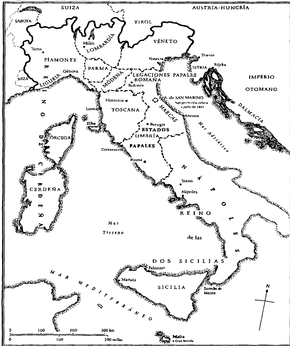
MAPA 1 Italia antes de 1861