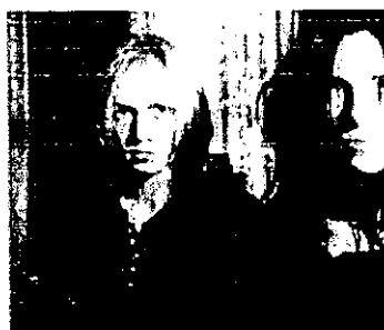
Rosetta Stone . Abril 2001