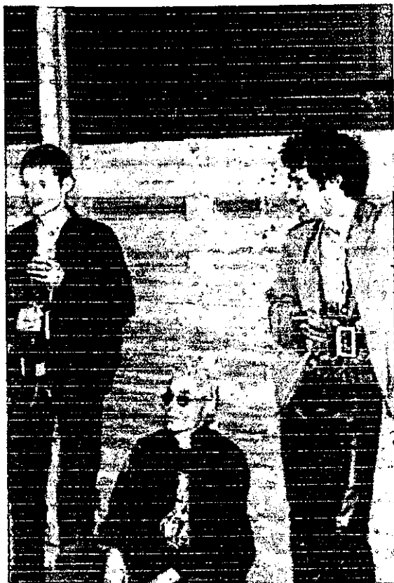
The Sisters of Mercy Abril 2001