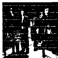
sesión fotográfica Bauhaus

Mayo 2001