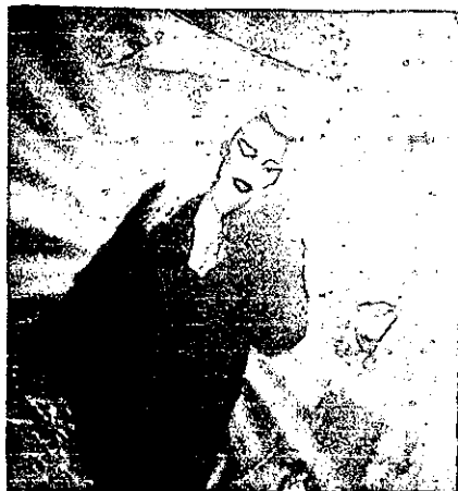
London After Midnight

Fotografía extraída de www.londonaftermidnight.com . Junio 2001