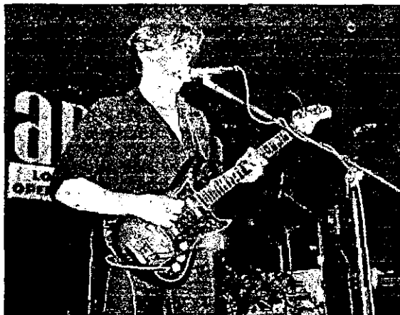
Robert Smith en los inicios de The Cure. Fotografía extraída de www.geocities.com/redgotica . Mayo 2001

Fotografía extraída de www.londonaftermidnight.com . Junio 2001