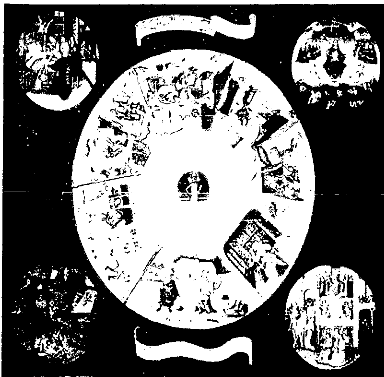
La mesa de los pecados capitales de Hieronymus Van Aeken Bosch (1450 – 1516) Museo del Prado, Madrid, España.

Se seleccionó esta obra para ilustrar el siguiente capítulo porque muestra en los círculos pequeños las cuatro postrimerías, es decir, la muerte, el juicio final (arriba), la gloria y el infierno (abajo). En el círculo grande que pretende ser un ojo vigía, están representadas escenas de los siete pecados capitales: soberbia, ira, lujuria, avaricia, gula, envidia y pereza. En el centro de este gran ojo, en lo que pareciera ser la pupila, se encuentra Cristo resucitado y la inscripción en latín cave, cave dominus videt (cuidado, cuidado que Dios te ve) Como podemos ver el artista posiblemente quiso plasmar una advertencia para aquellos que quisieran alejarse de la fe cristiana y caer en pecados que pudieran arrastrarlos al infierno.