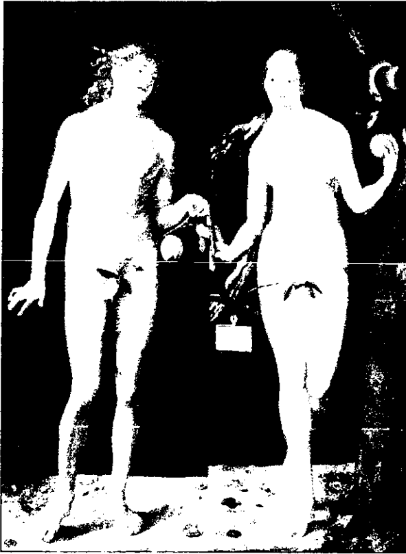
Adán y Eva por Alberto Durero. (1471-1528) Museo del Prado, Madrid, España.

Este par de pinturas realizadas en el año 1507, representan a Adán y a Eva en el Paraíso. Adán en su mano izquierda sostiene una rama del manzano, mientras que Eva sujeta el fruto del pecado. Es importante que el lector observe en la pintura de la derecha a la astuta serpiente enroscada en el árbol junto a Eva.