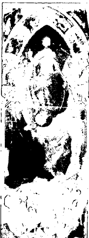
La Redención (detalle). Tríptico de Vrancke van der Stockt (1420-1495) Museo del Prado, Madrid, España.

Este detalle pertenece a la puerta de la derecha donde puede verse el Juicio Final, presidido por Cristo Juez al que acompañan a sus pies, la Virgen y San Juan Bautista. En la parte inferior se presenta la resurrección de los muertos, divididos en dos grupos: a un lado los elegidos y al otro los réprobos. En el trasdós de su correspondiente arco se presentan las obras de Misericordia: vestir al desnudo, dar de beber al sediento, dar de comer al hambriento, dar hospitalidad a los extranjeros, visitar a los presos y curar a los enfermos.