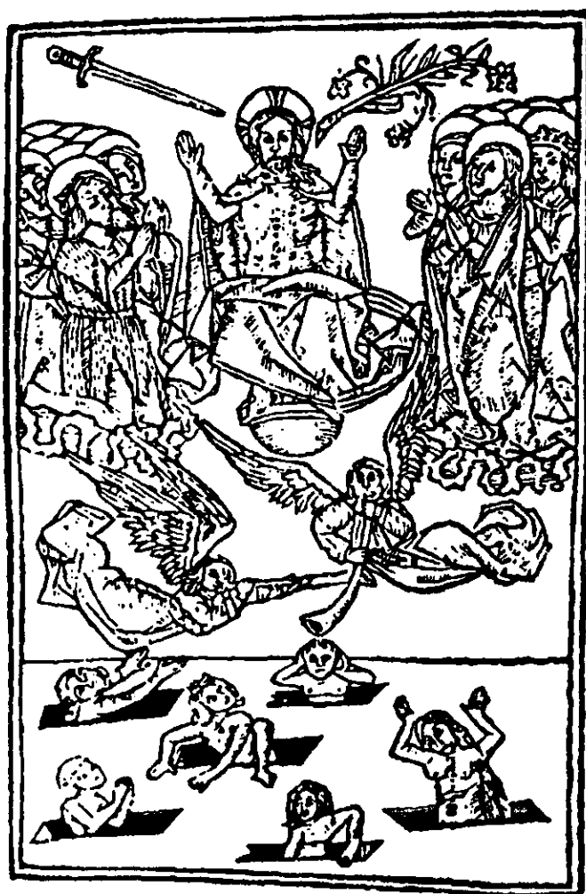
Grabado de El Juicio Final , fechado en Burgos, 1498. En esta ilustración podemos ver a Jesucristo al centro, a sus pies los arcángeles tocando las trompetas en señal del anunciamiento del juicio, abajo la resurrección de los muertos.