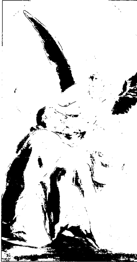
La visión de San Juan, de Alonso Cano (1601-1667) Colección Wallace en Londres.

En esta pintura podemos ver a San Juan a los pies del ángel que le muestra una visión celestial (resaltada en esta ilustración). Como se puede observar el cielo es concebido como una ciudad entre las nubes, amurallada, urbanizada y perfectamente trazada. Donde viven Dios, los ángeles y los elegidos.