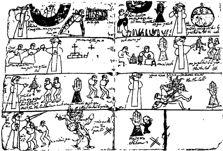
Tomado de la revista Arqueología Mexicana, núm. 38, p. 34

El código testeriano, el “Padre Nuestro”, es tomado de la Doctrina Christiana . Esta ilustración, muestra el método utilizado por Jacobo de Testera en los códices pictográficos, con ellos, los frailes intentaban acercar la doctrina cristiana a través de los medios utilizados por los indígenas para plasmar asuntos relacionados con la historia, la sociedad o la religión.