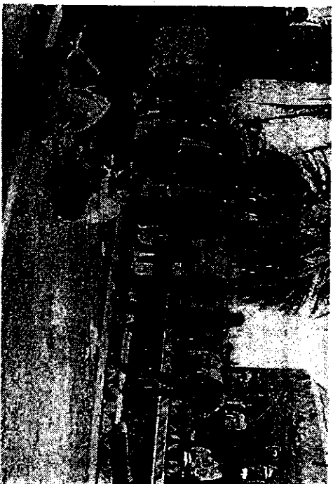
ESTOS JOVENES, estudiantes del antiguo Colegio Nacional de Agricultura, esperan noticias acerca de la devolución de su plantel.

Miembros de la primera plana El doctor Braver y el personal de la más al secretario de Agricultura y Gana-