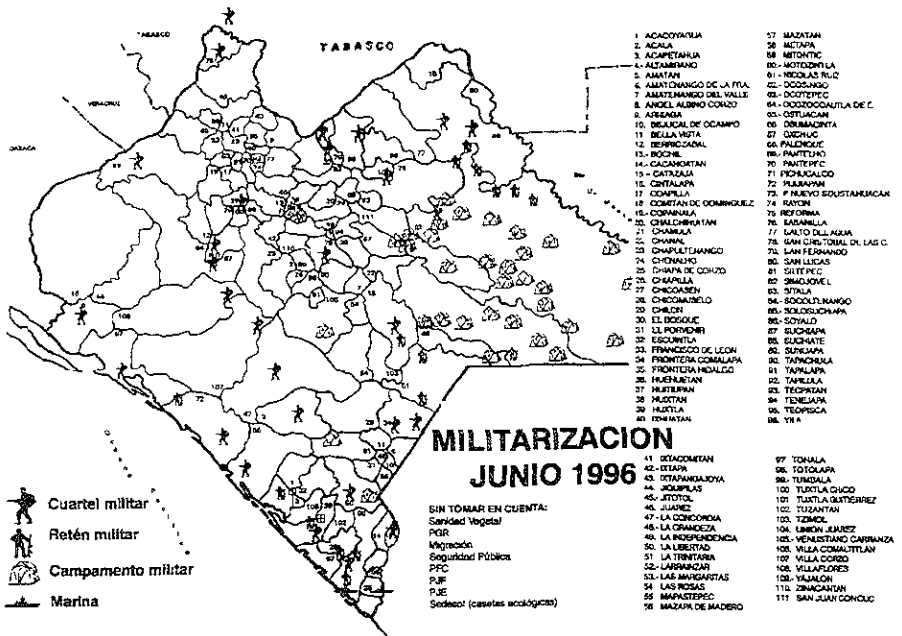
“Militarización y Violencia en Chiapas” Coordinación de Organismos no gubernamentales por la Paz (CONPAZ), Centro de Derechos Humanos Fray Bartolomé de las Casas, Convergencia de Organismos Civiles por la Democracia, Producción editorial Servicios Informativos Procesados (SIPRO), México, D F, Julio de 1996,