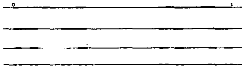
Figura 1. Ilustración de la construcción de C_1, C_2, C_3 y C_4 .

En general, C_{m+1} se construye dividiendo en tres partes iguales a los intervalos que componen a C_m y borrando los intervalos abiertos intermedios.