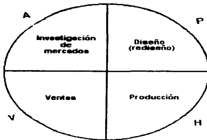
Diagrama I - Círculo de Calidad de Deming