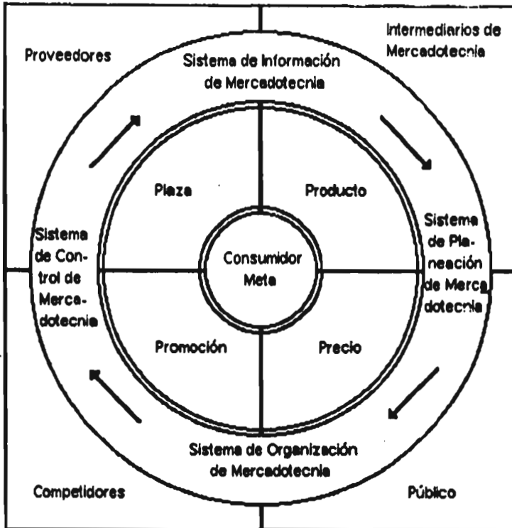
FIGURA 1 Factores que influyen en la estrategia de mercadotecnia de la empresa.