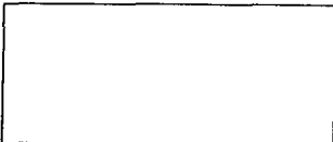
PAÑ DE FOTO

NAFIN otorgó un crédito de cinco mil millones de pesos para el desarrollo de la industria y el comercio en Querétaro, a través del Banco de Comercio Exterior, S. A. (Banco Exterior) y el Banco de México.