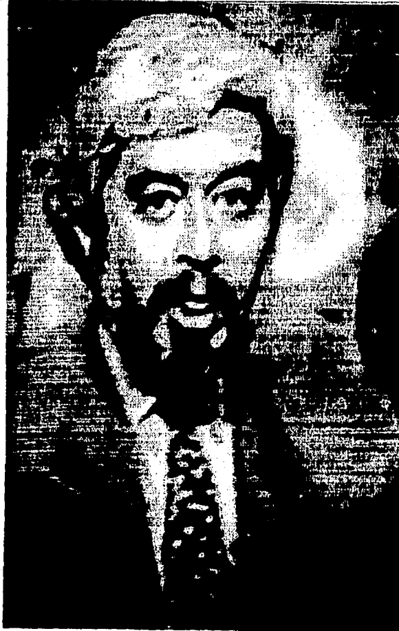
Entrevista a Jaime Maussan 19