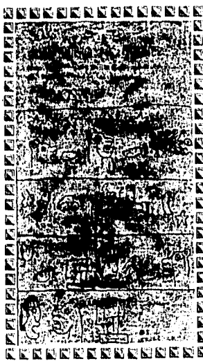
Este códice fue escrito en el Taller Museo del Ingenio

La Feria de los Libros León, Gto., 2 de mayo 1994