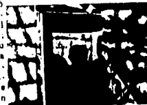
Para Rubén Dávalos...

Se cubrió de fuegos el lugar; la de su esposa Chaili-cuc que según