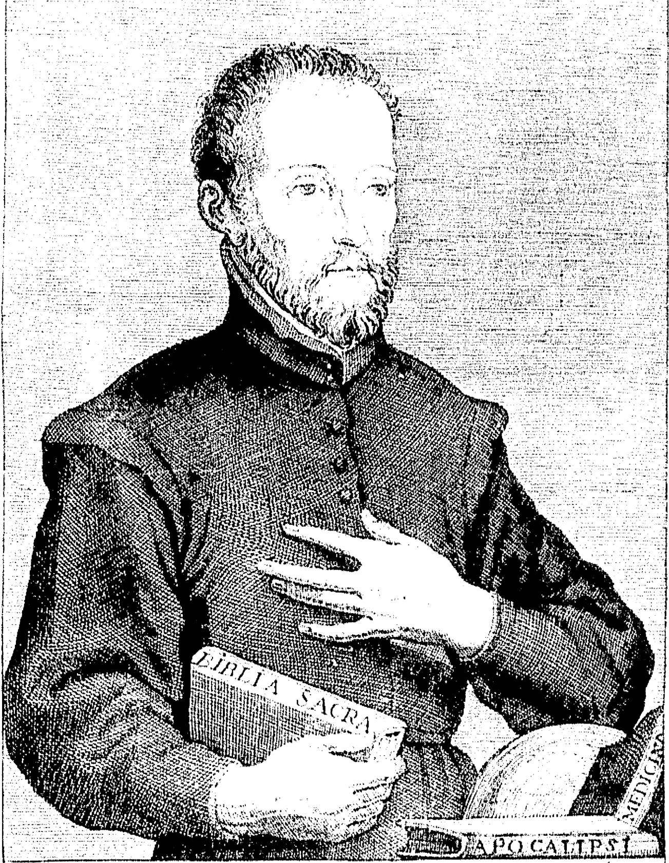
FIN Siervo de Dios GREGORIO LOPEZ natural de Madrid murió en la Nueva España a los 29 de Julio de 1756 donde vivió 55 años en soledad, infirme en Viriudes y Sanidad. 6 años de su vida a 5.