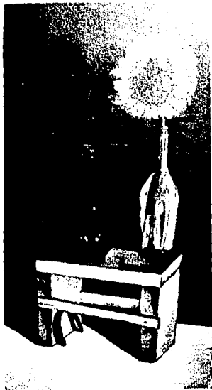
Ilustración No 2