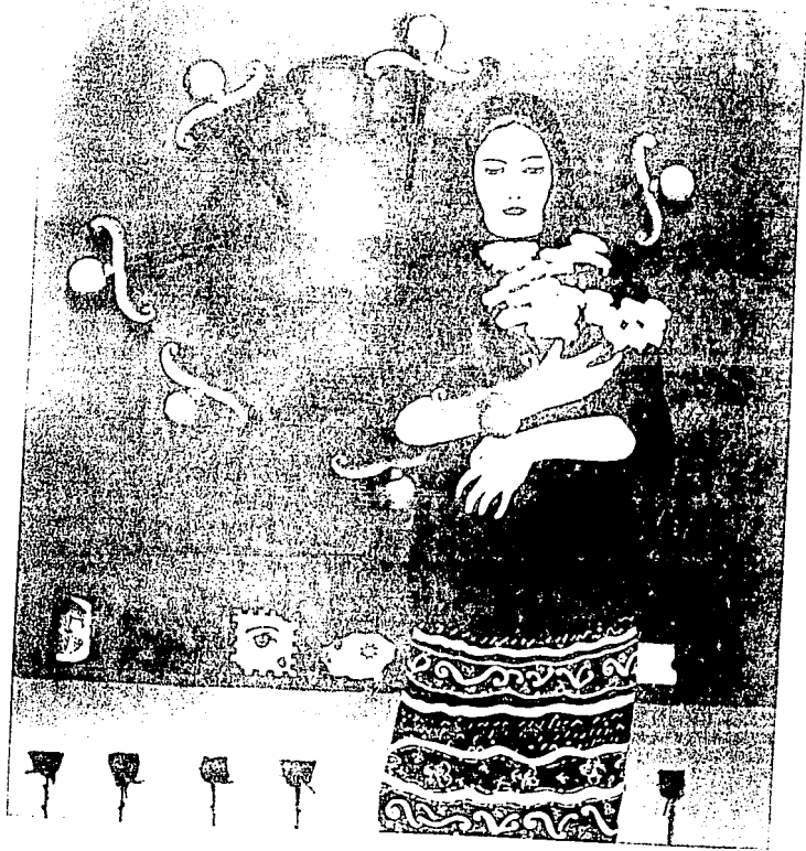
Los siete dolores de María. Óleo sobre tela, collage 155 X 135 cm 1995