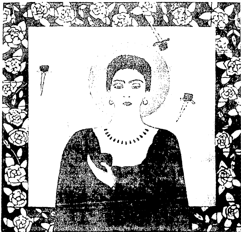
El dolor de las rosas Oleo sobre tela collage 120 X 120 cm 1995