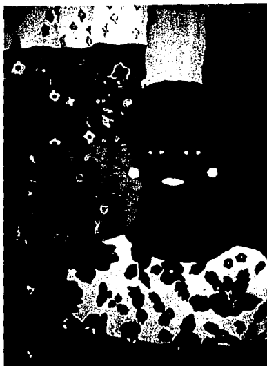
Ilustración No 3'