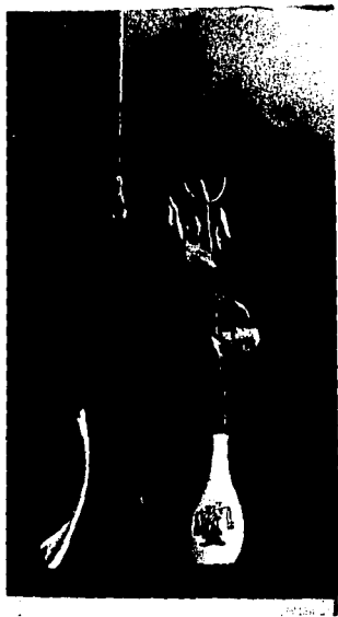
Ilustración No 1