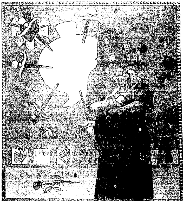
Los dolores de Maria. Oleo sobre tela, collage 155 X 135 cm 1995.