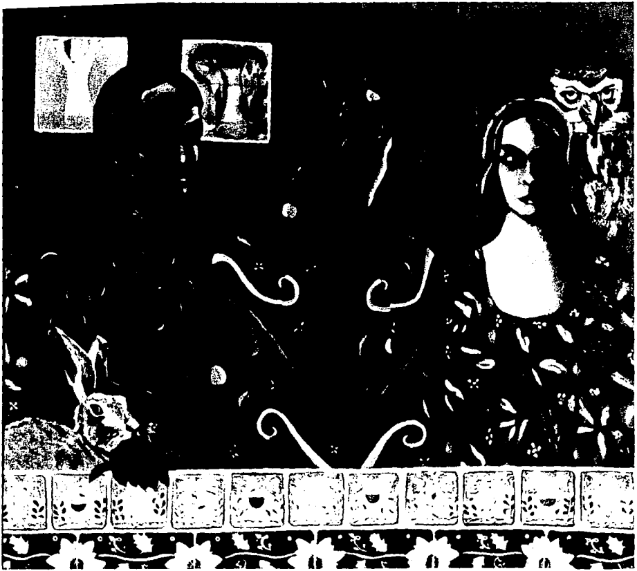
Principio sin fin, ¿aún estás por ahí? Óleo sobre tela 135 X 155 cm 1995.