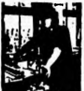
12. Ich habe wie immer an der Maschine gearbeitet.