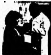
3. Mein Arm hat sehr weh getan, und ich bin zum Arzt gegangen.