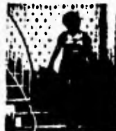
1. Dann habe ich die Bleiflaschen nach unten gebracht.