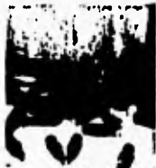
10. Mitzlich bin ich gefallen.