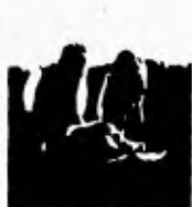
7. Meine Freundin hat den Arzt geholt. Er hat gesagt: „Das Bein ist gebrochen.“