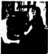
3. Meine Kollegin ist gekommen und hat mir geholfen.