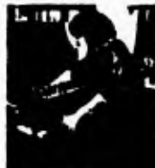
6. Mitzlich hat meine Hand in die Maschine bekommen.