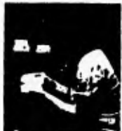
11. Ich habe die Küche aufgeräumt.