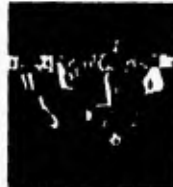
2. Ich habe Fußball gespielt.