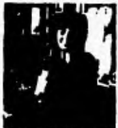
4. Mensch, da habe ich laut geschrien.