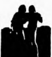
8. Ich bin wieder aufgestanden. Aber das Bein hat so sehr weh getan.