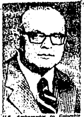
U.S. Ambassador to Colombia Diego Ascencio. (File Photo)