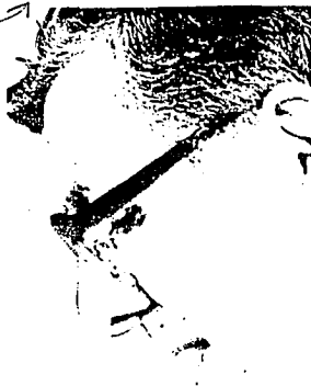
El Presidente Turbay Ayala

MIÉRCOLES 31 DE DICIEMBRE DE 1980 - EL TIEMPO - 9-D