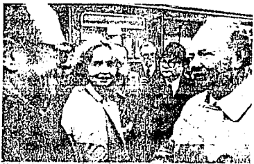
L'ambasciatore austriaco (a destra) all'arrivo a Vienna

VIENNA — È tornato ieri in patria l'ambasciatore austriaco Edgar Selzer liberato dai guerriglieri del movimento M-19 che dal 21 febbraio trattengono all'ambasciata della Repubblica colombiana a Bogotà ancora 14 diplomatici più altre persone. Selzer è stato liberato per ragioni umanitarie: la moglie Edith è gravemente ammalata e il diplomatico dopo recenti tentennamenti brevemente si parolò con l'aereoporto è corso da lei all'ospedale.