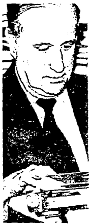
Pastrana escribe a máquina

"Yo creo, manifesté para remarcar, que no obstante todo el ruido que se publica sobre Colombia, existe el reconocimiento de que es una de las pocas democracias subsistentes de este continente. El motivo del caso de la ocupación de la Embajada Dominicana le han dado al presidente Turbay un aspecto positivo, y a nuestras estructuras democráticas la fama de democracia madura. Paradójicamente me ha sido un acierto poder establecer un gobierno y una democracia, sobrevivió para espectralistas".