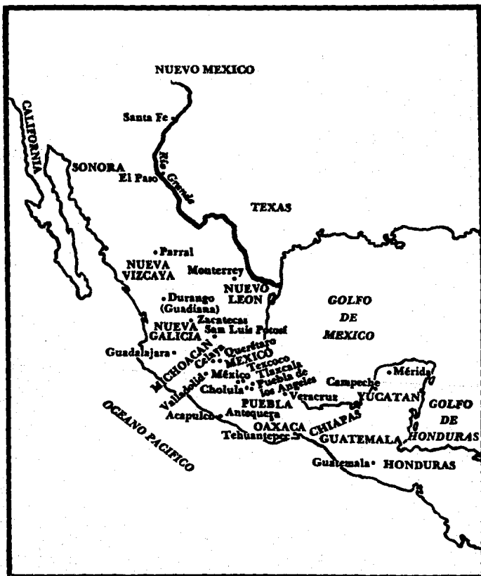
Nueva España en el siglo xvii