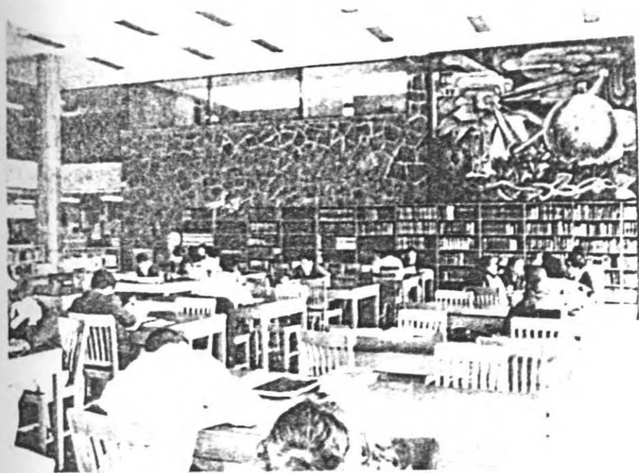
FOTOGRAFIA DE SALA DE CONSULTA.