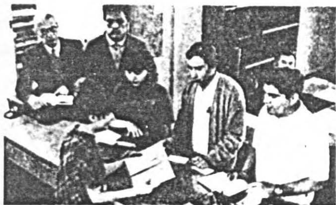
FOTOGRAFIA DE PRESTAMO EN LA SALA DE LECTURA.