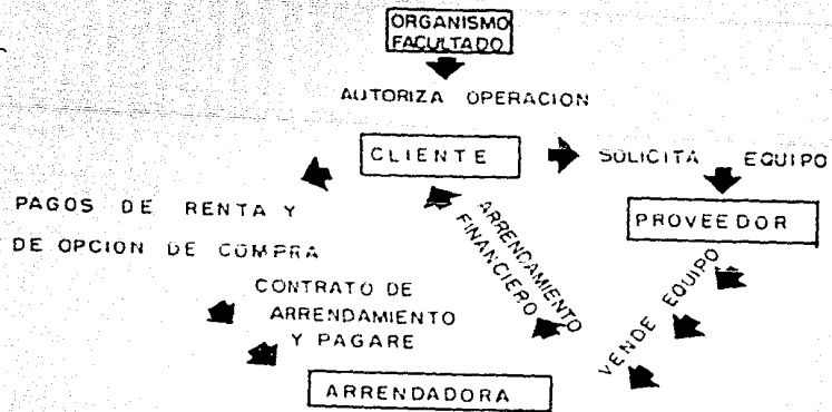
DIAGRAMA DE UN ARRENDAMIENTO