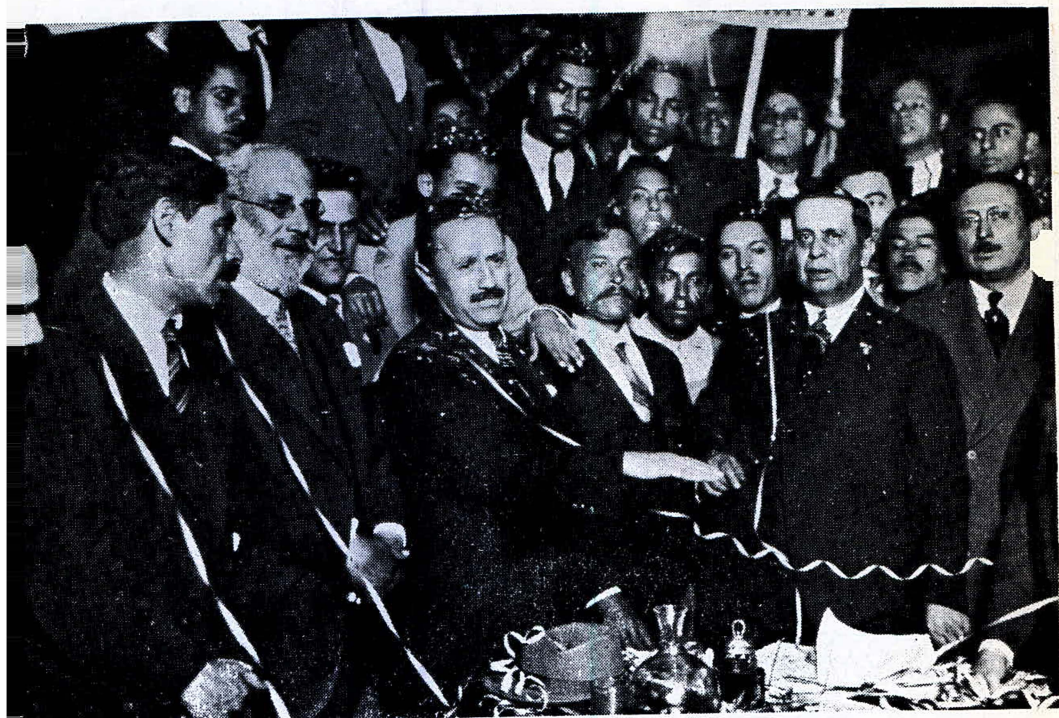
Vasconcelos protestando como candidato a la Presidencia de la República (1929).