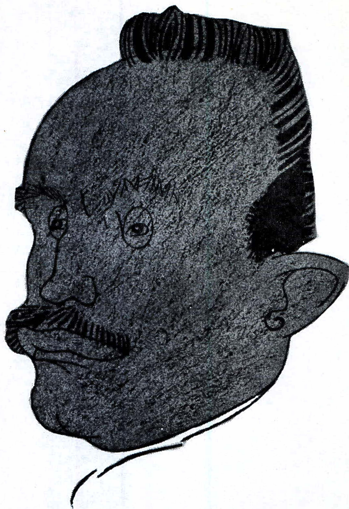
JOSE VASCONCELOS, EL HOMBRE

" Me parece lo más grande que ustedes tienen en América, y yo querría escribir su vida entre las de mis hombres ilustres ."