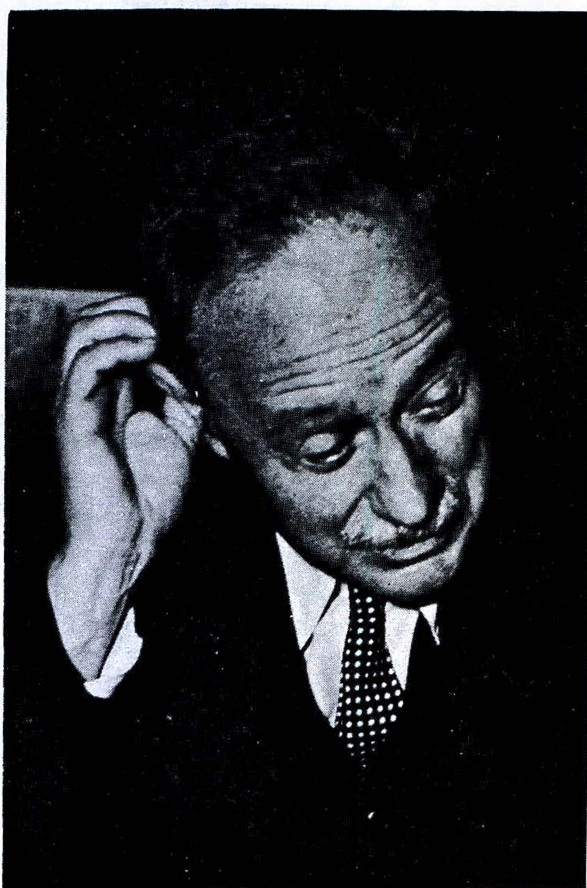
JOSE VASCONCELOS, HISTORIADOR

" El que escribe sobre su propio pueblo y con miras a encontrar en la historia las fuerzas dispersas que acaso puedan contribuir a salvarlo, tiene que poner en su obra dolor de parte ofendida y pasión - de justicia, exigencias de rehabilitación del futuro. "