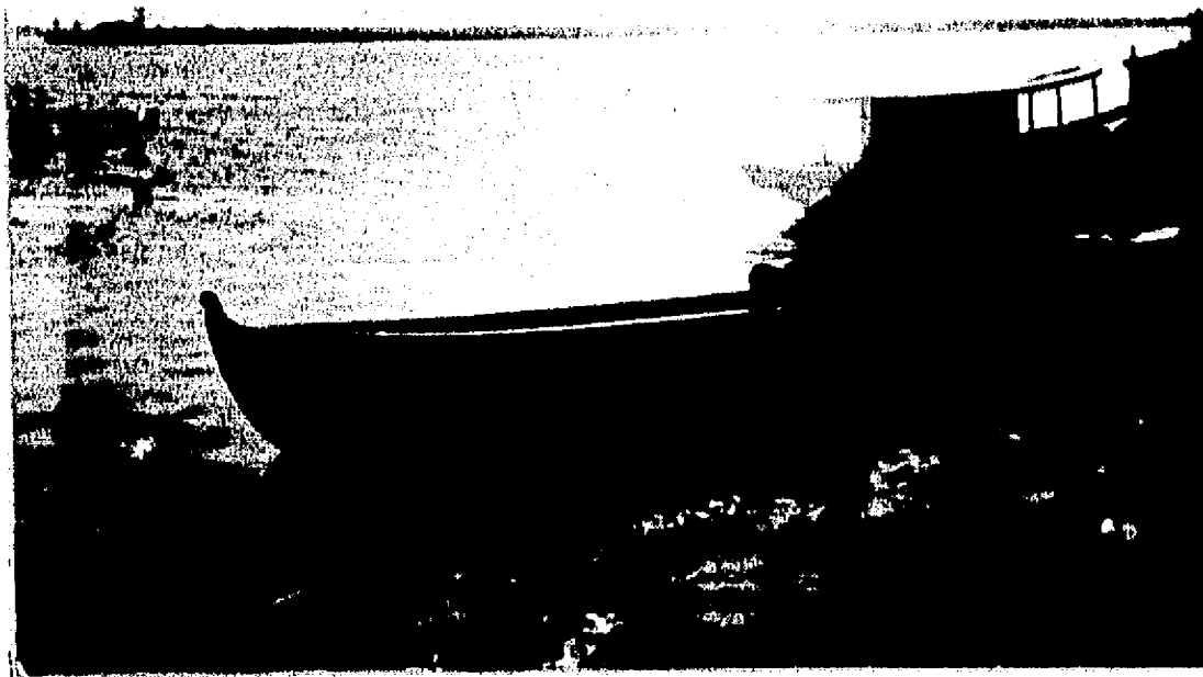
El río de las Mariposas