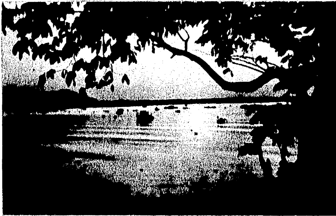
El Papaloapan, señor natural de la región.