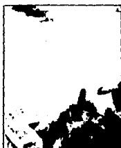
LAMINA 7 (C7)