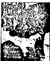
LAMINA 9 (C9)