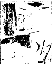
LAMINA 12 (C12)