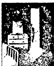
LAMINA 6 (C6)