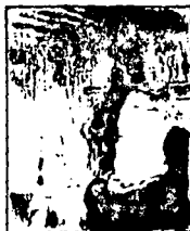
LAMINA 3 (C3)