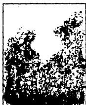
LAMINA 2 (A2)