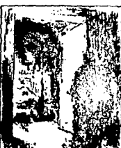
LAMINA 11 (C11)