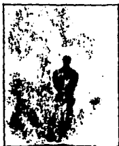
LAMINA 1 (A1)