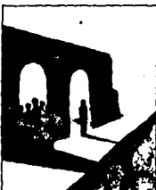
LAMINA 10 (B10)