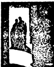
LAMINA 4 (B4)