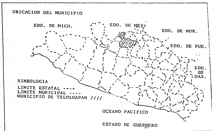
MAPA No. 3