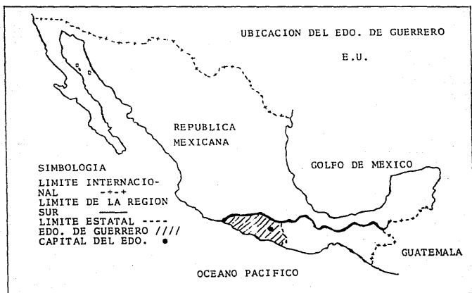
MAPA No. 2