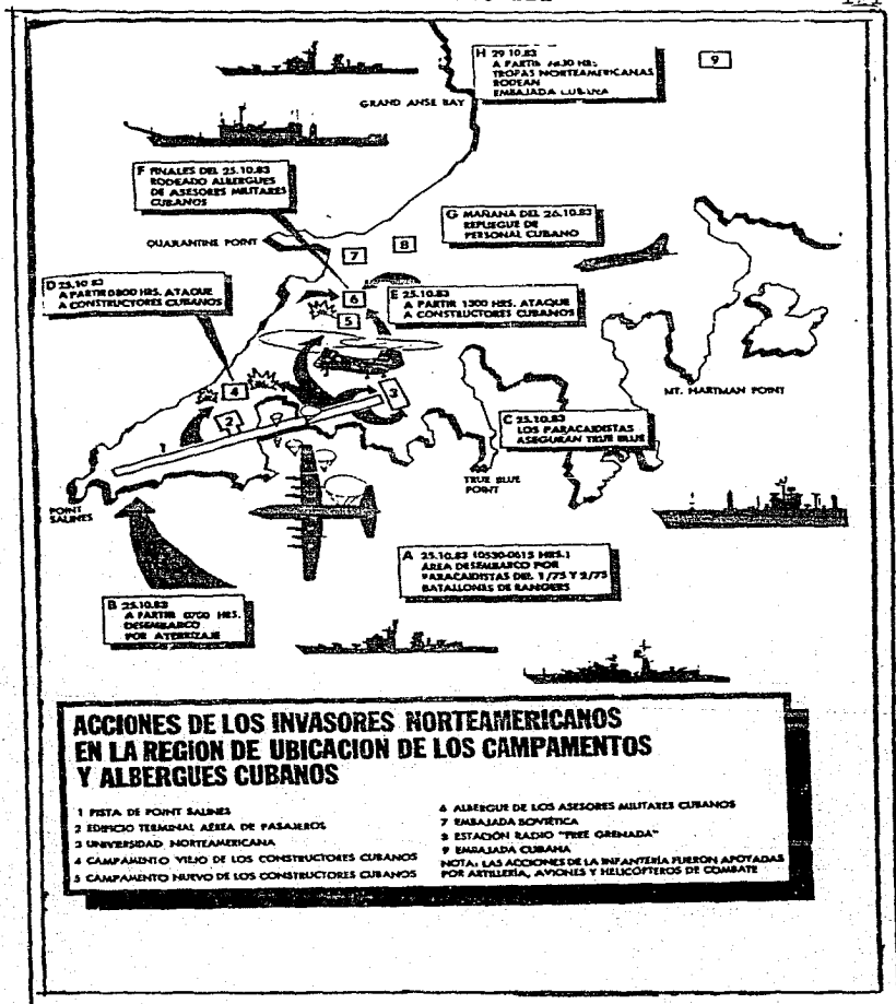
MAPA III, Obtenido del libro ; Granada, El Mundo Contra el Crimen ob. cit. Pág. 45.