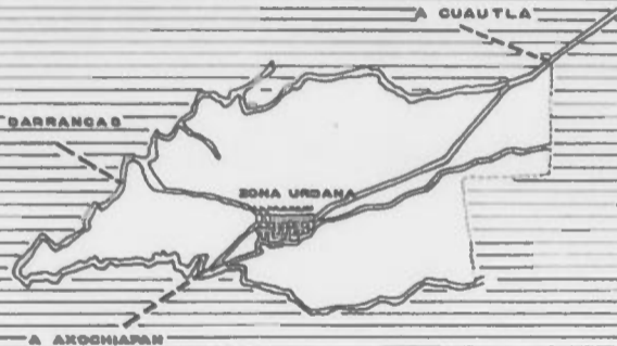
EJIDO "SAN JOSE QUEBRANTADERO" MUNICIPIO DE AXOCHIAPAN EDO. DE MORELOS