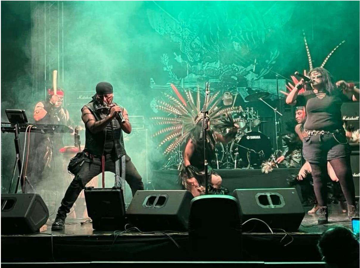
Imagen 12. Banda Téotl en el escenario en la presentación del Mexican Brutality evento realizado en la Ciudad de México el 30 de julio del 2022 en el Circo Volador.

esto, es así que las bandas de metal “prehispánico” justifican su labor para dar a conocer las culturas nativas, reivindicar los valores ancestrales, conservar un ambiente más orgánico y revalorar el pasado cosmogónico.