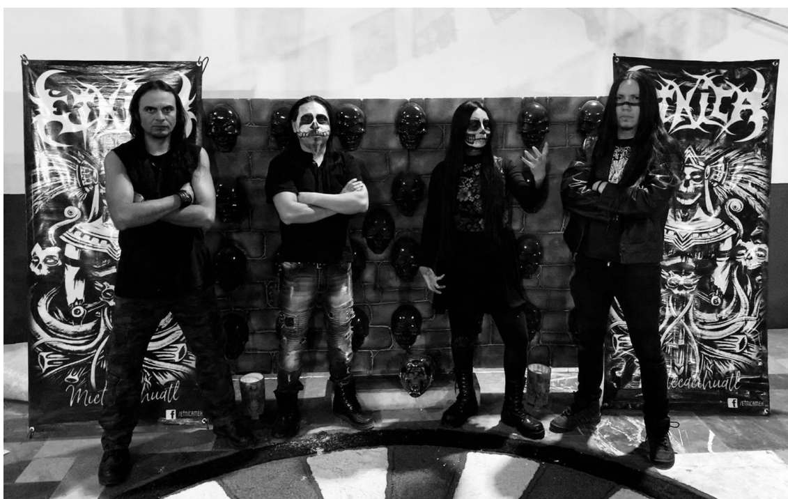
Imagen 22. Agrupación Étnica en la ofrenda de día de muertos de Santa Bárbara Cuautitlán Izcalli, 2023.

...el Tenochtitlan Vive yo lo conocí más o menos por el 2009 pero creo que ya había habido conciertos antes y nosotros tocamos en el 2016, en el último Tenochtitlan Vive. No recuerdo cómo se llamaba el organizador de este evento, la verdad es que era un evento grande. Se empezó a hacer aquí en la Ciudad de México y pues ya fue tomando diferentes localidades, a nosotros nos tocó en Hidalgo. Y había otro festival que también ya se perdió que se llamaba Obsidiana Fest, prácticamente todos los eventos fueron ahí en lo que es la localidad de Teotihuacán, San Juan. 85