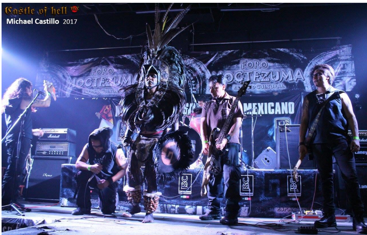
Imagen 24. Agrupación Velomic en el Milicia Infernal edición 2017 en el Foro Moctezuma.

El metal prehispánico/ folk metal mexicano, es un género que ha conformado en la escena del metal mexicano un estilo encaminado a la reivindicación y revalorización de las culturas mesoamericanas forjando una identidad desde donde se enuncia. En esta última etapa que identifiqué hay un elemento muy importante que hace que el subgénero del metal prehispánico se consolide y tiene que ver con el internet y las redes sociales, lo que permitió una mayor difusión de bandas, una construcción de lo translocal permitiendo que los grupos de la Ciudad de México logaran tener presencia en otros estados de la República y viceversa.