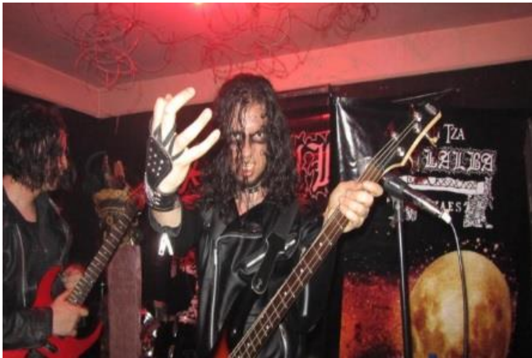
Imagen 13. Banda Xibalba Itzaes de la Ciudad de México. Presentación en Sabbath Pub (10 de septiembre de 2016).