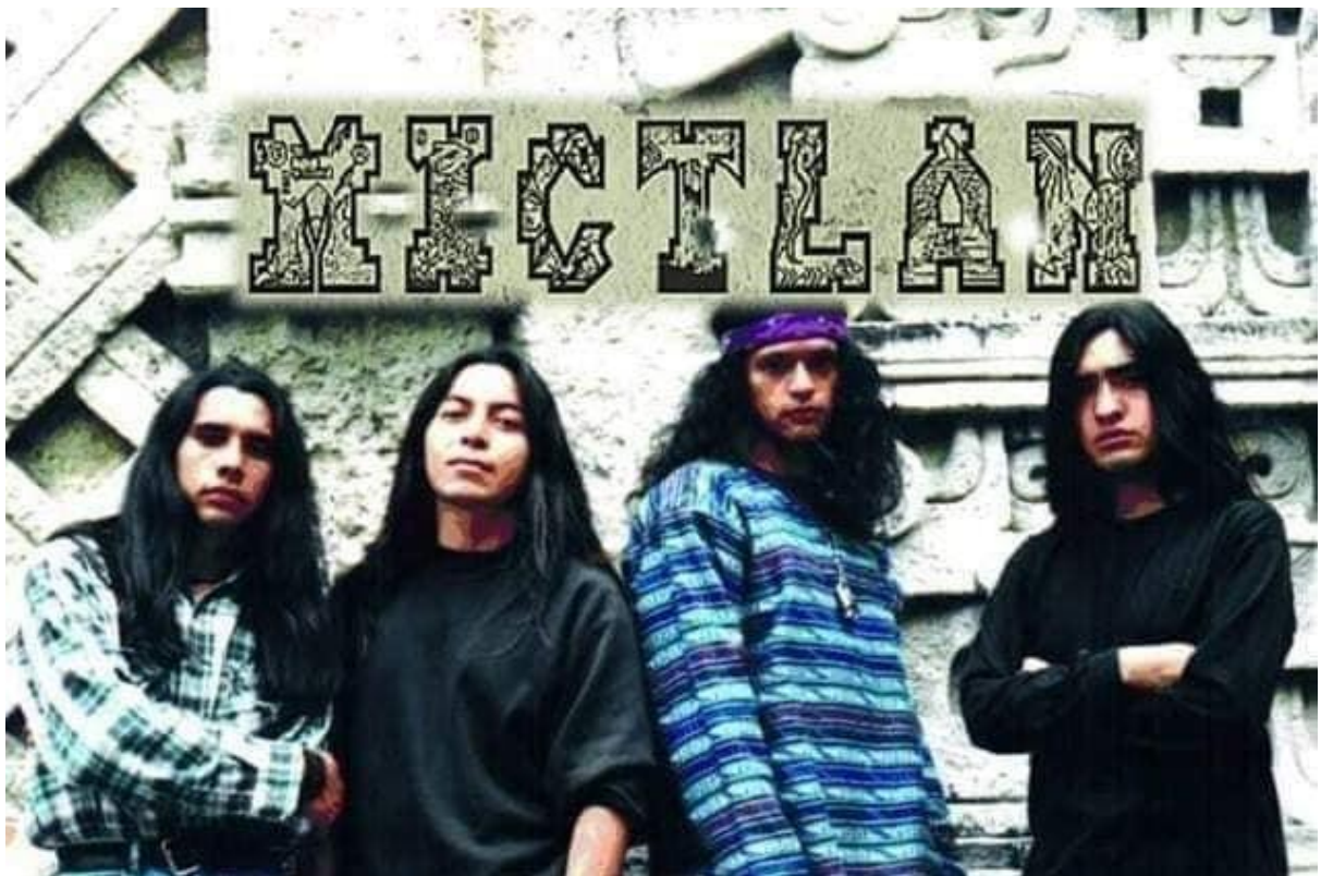
Imagen 19. Agrupación Mictlán.