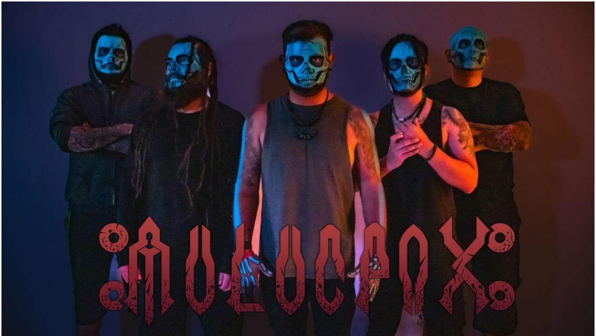
Imagen 20. Agrupación Muluc Pax.

cuatro materiales de larga duración se lanzaron bajo el sello discográfico de Kukulcan Records 666.