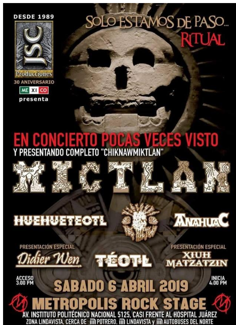
Imagen 8. Flyer de una tocada de metal con bandas de metal prehispánico/ folk metal realizada por JSC Producciones, [en línea].

Otro elemento importante es la iconografía, es decir, el aspecto visual y la representación en las imágenes. No solo con la música y letras las agrupaciones crean un discurso del metal ligado a lo prehispánico. Todos los contenidos visuales que se generan en este estilo de metal, los podemos apreciar en el arte de los discos, los carteles de las tocadas, en los logos de las bandas, las fotografías de los integrantes para promocionar y difundir su música, en donde se expone gráficamente el simbolismo y la ideología respecto al mito prehispánico.