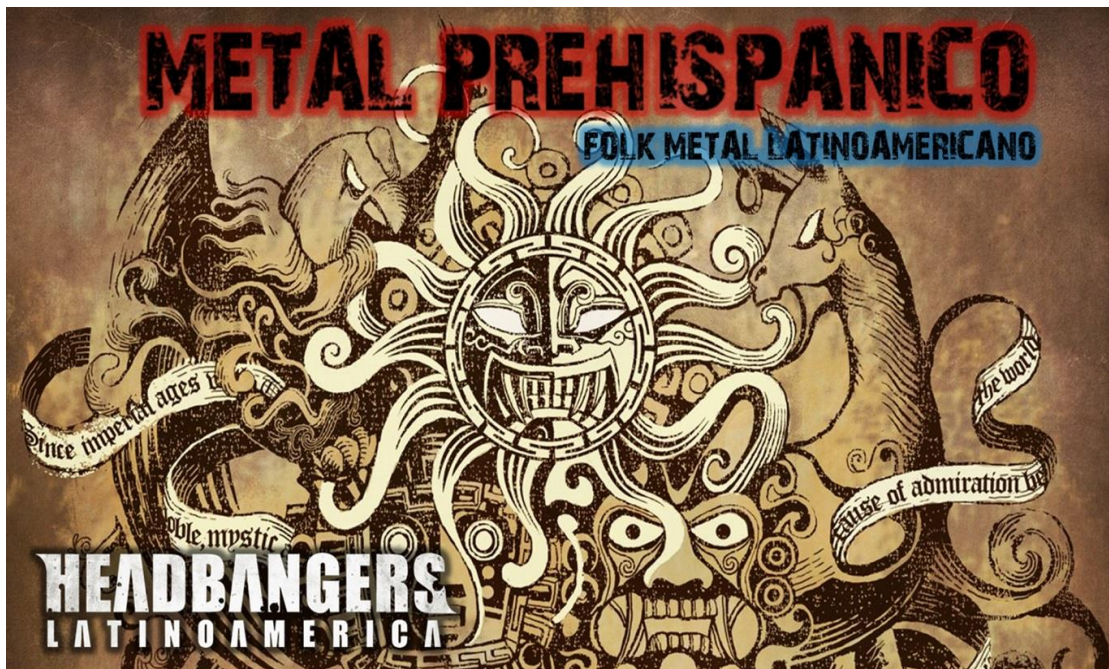
Imagen 1. Portada de la nota: Metal Prehispánico. Folk metal Latinoamericano [en línea].

evolución con el Metal Árabe que también viene en crecimiento ( Headbangers Latinoamérica , 2020).