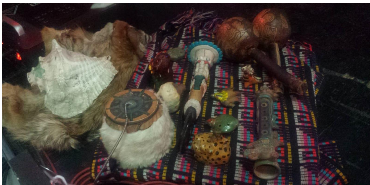
Imagen #7.

Me gustaría comenzar por mencionar la dotación instrumental propia del metal prehispánico / folk metal mexicano y que es exclusiva de este subgénero del metal. Se utilizan instrumentos análogos como guitarras eléctricas y/o acústicas, bajo eléctrico, batería, teclados/sintetizadores, voz gutural y algunas veces coros.