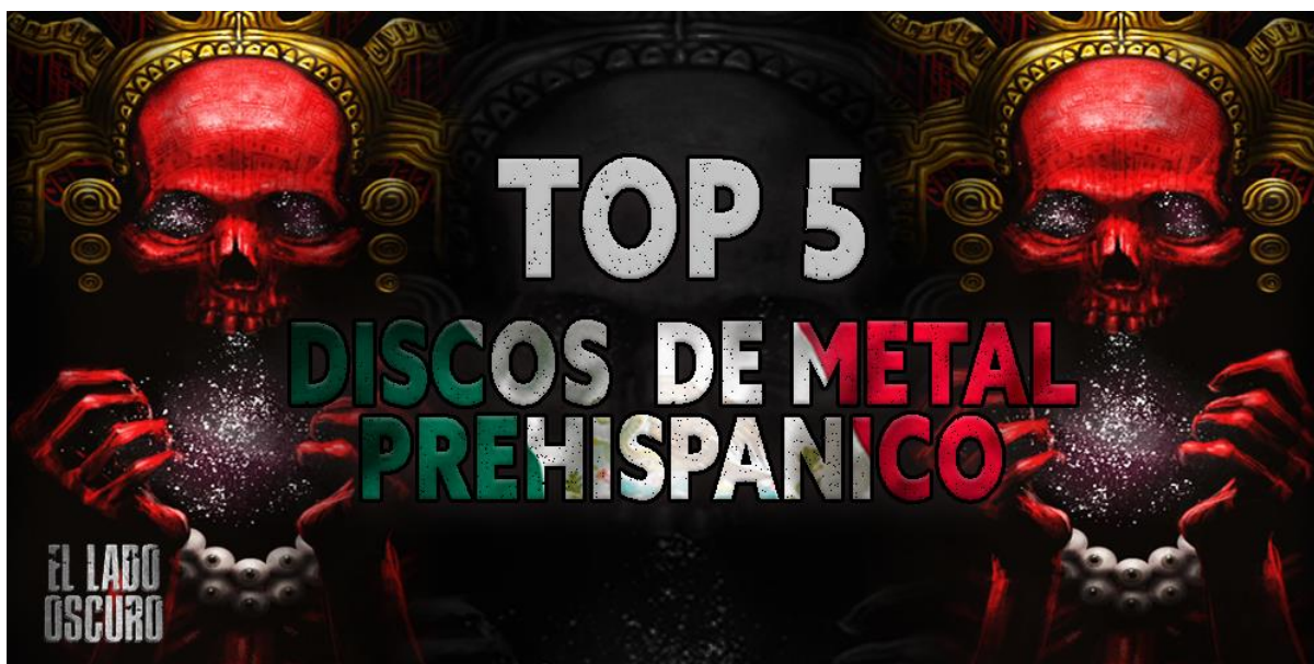
Imagen 6.

Esta fusión con instrumentos prehispánicos también la encontramos en algunas agrupaciones como Izkra con una influencia más heavy , o como Herejía con un estilo speed y punk que hacen canciones en lenguaje náhuatl, sin embargo, el death y el black metal se han caracterizado por ser la base más usual de esta fusión. Por ello, se trata de un subgénero del metal ya que recupera elementos sonoros y visuales del metal convencional sumando la referencia de los pueblos originarios y su cosmovisión.