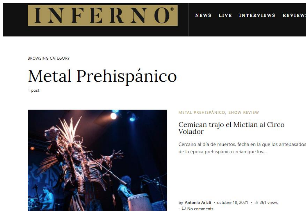
Imagen 2. Captura de pantalla, página Summa Inferno, Metal Prehispánico, [en línea].