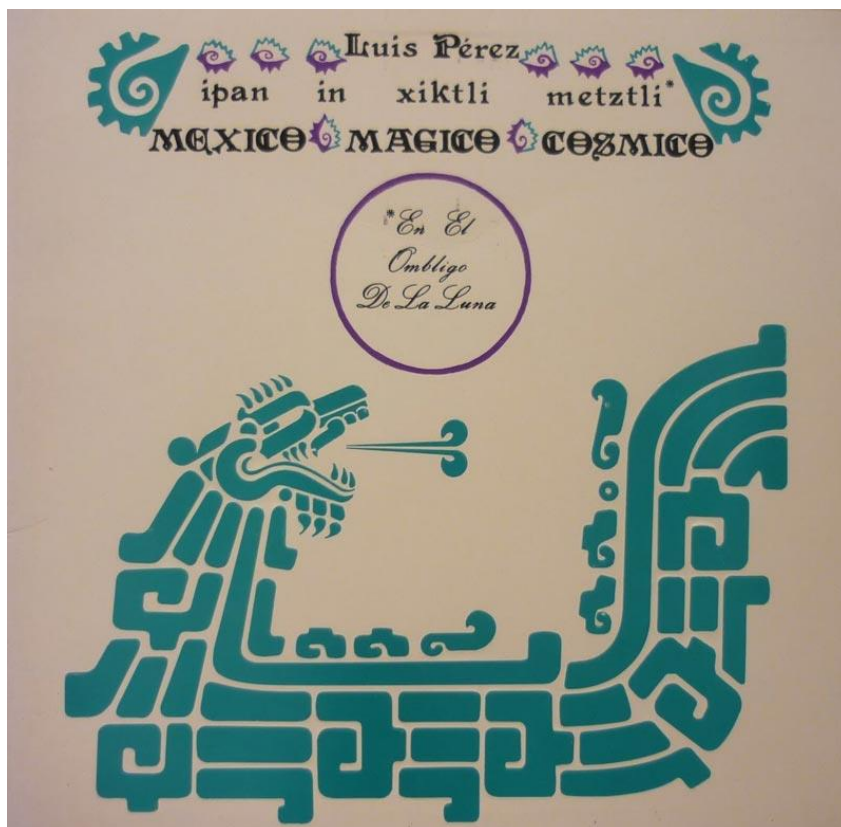
Imagen 16. Portada del disco "Ombligo de la Luna" de Luis Pérez de la Revista NEXOS, [en línea].