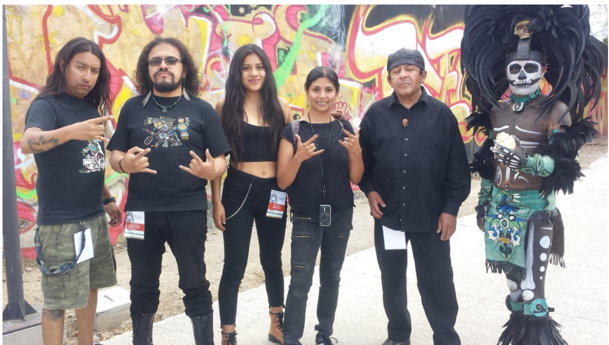
Con la agrupaci6n Mikistli en el 8vo. Encuentro Nacional de "Tradici6n y Nuevas Rolas".

En general, a todos los que han sido compa1a en este largo camino un profundo agradecimiento desde lo profundo de mi cora .