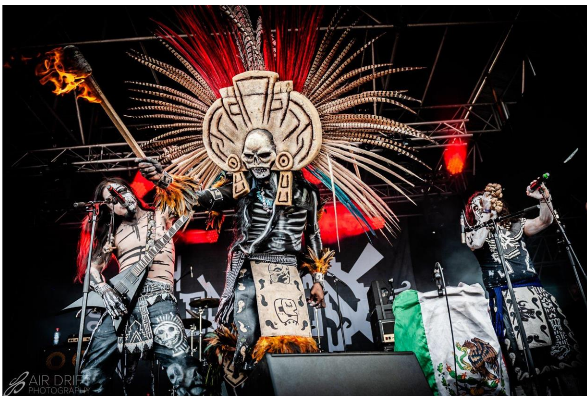
Imagen 21. Agrupación Cemican originaria de Guadalajara, Jalisco en el festival Wacken Open Air en 2018.

Hoy en día, entre las bandas que sobresalen por su vigencia se encuentran, por ejemplo, Cemican originarios de Guadalajara, Jalisco formando este proyecto en el año 2006. Con una base musical del death metal y power metal 84 y con líricas particulares de la mitología Azteca y Maya, comienzan esa búsqueda de crear un sonido con el cual se sintieran identificados, llegando así al género del metal prehispánico/ folk metal mexicano. Su presencia en los escenarios ha sido frecuente y han tenido la oportunidad de compartir escenario con bandas de Folk Metal como Korpiklaani de Finlandia en el 2015 y Finntroll también de Finlandia en el 2016 y en Festivales como el Hellfest Open Air , el Cernunnos Pagan Fest y el Wacken Open Air .