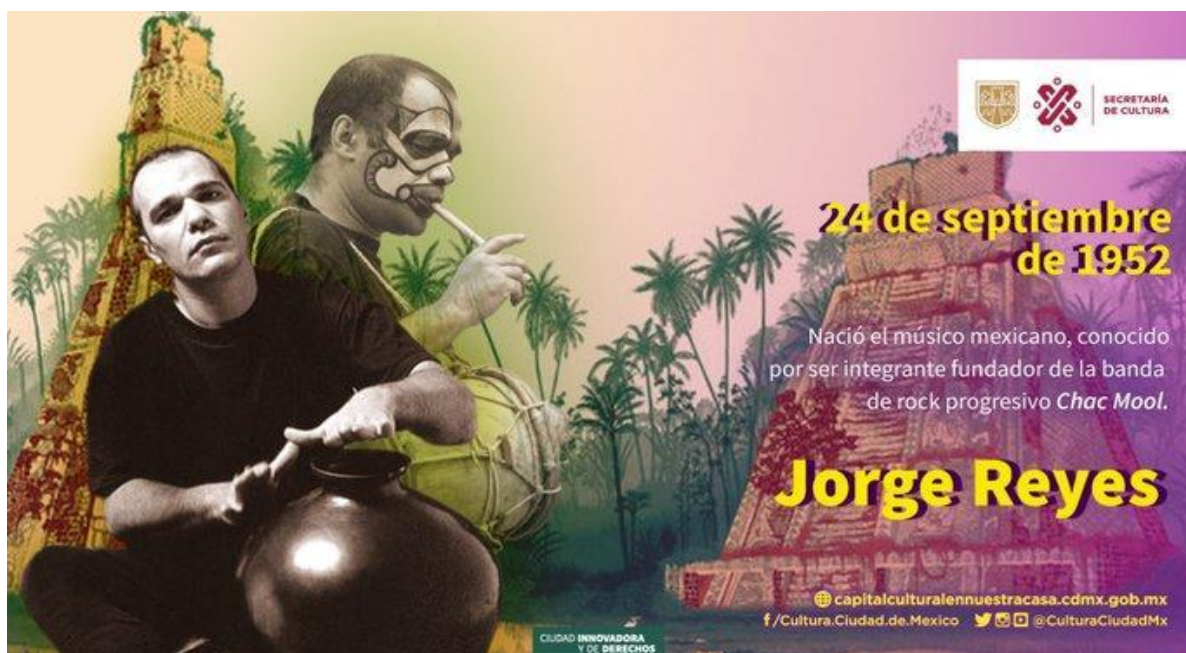
Imagen 15. Flyer postado en la red social Twitter de la Secretaría de Cultura de la Ciudad de México en conmemoración al músico Jorge Reyes [en línea].