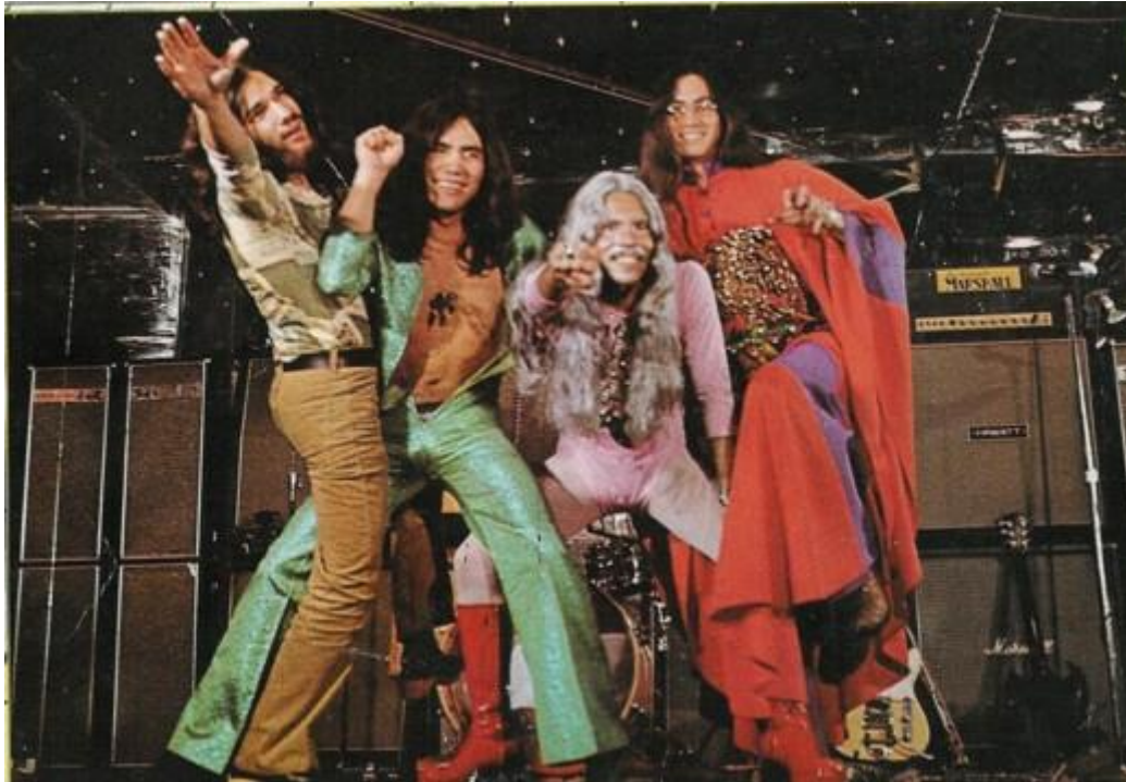
Imagen 14. Grupo Nuevo México, [en línea].

Al iniciar la década comenzó un proceso que se materializó en la fusión de instrumentos prehispánicos con el rock y que más tarde se bautizó con el pomposo nombre de “etno rock”. Grupos como Náhuatl, Toncho Pilatos, Nuevo México y Mr. Loco dejaron algunas composiciones en las que trataron de lograr una alquimia entre la música pretendidamente mexicana y el rock (p. 162).