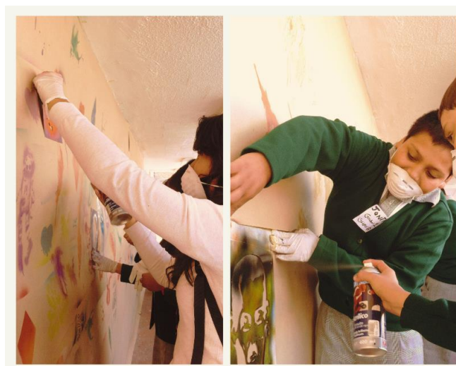
Figura 4. Programa “Alas y Raíces” AR3. Taller “Arte Urbano”. Escuela Secundaria diurna núm. 126 Tlahuizcalli, Tláhuac, 2015.