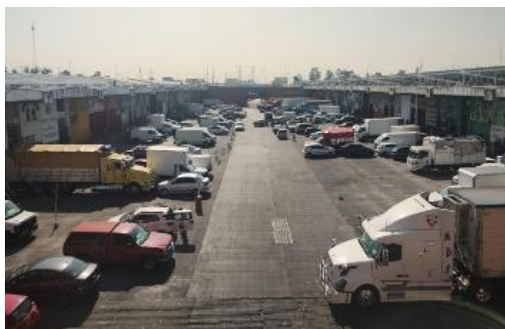
Figura 2. Central de Abastos de la Ciudad de México, Iztapalapa.

En la alcaldía Iztapalapa es común encontrar manifestaciones de las prácticas culturales anteriormente mencionadas, es el caso de la economía sobre ruedas que se instala en distintos puntos de comercio dentro de esta demarcación, en ella encontramos el más grande mercado mayorista de la ciudad: “La Central de Abastos” (Figura 2) que proporciona a la población un servicio de abastecimiento de productos básicos al mayoreo prioritariamente, permitiendo dispersar los productos que llegan del interior de la República a los pequeños comerciantes de la ciudad.