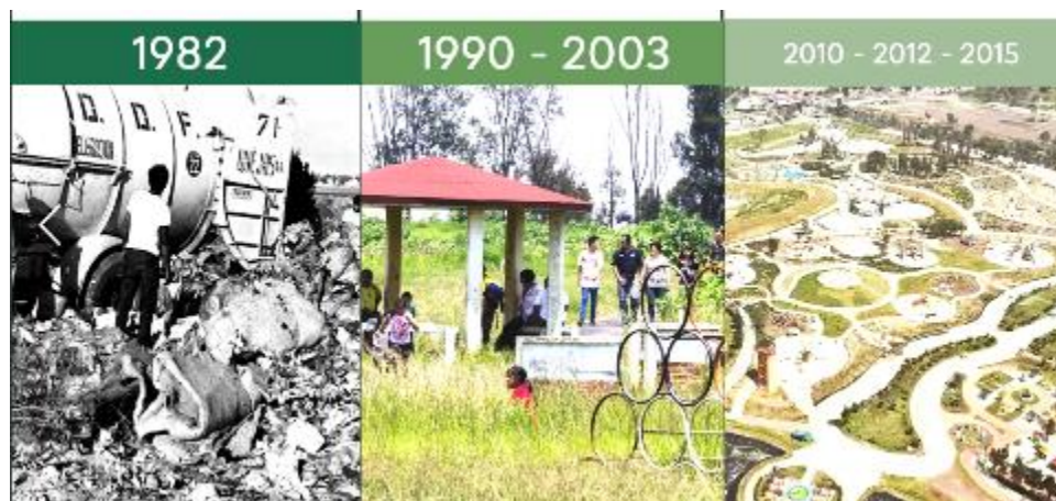
Figura 11. Proceso de recuperación del Parque Cuitláhuac, Iztapalapa.