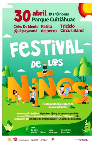
Figura 12. Cartel de difusión realizado para evento en Parque Cuitláhuac, Iztapalapa, 2022.