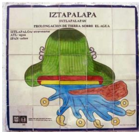
Figura 1. Glifo de Iztapalapa

Así mismo, este geógrafo nos habla de la importancia de la toponimia (Figura 1) que muchas veces retoma elementos del paisaje para nombrar determinado lugar, sus características ambientales o sociales, donde intervienen las leyendas y los vínculos que la gente que lo habita genera con el espacio: “Nombrar los lugares es impregnarlo de cultura y poder” (Claval 1995: 166 en Fernández, 2006: 232).