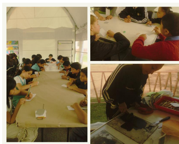
Figura 3. Programa “Alas y Raíces” AR3. Taller “Flipbook – Ex Libris”, Centro Nacional de las Artes, 2016.

En este contexto es importante señalar, para este informe de trabajo profesional, que uno de los antecedentes dentro de mi quehacer en la vinculación comunitaria fue el apoyo a la realización de las jornadas en el programa “Alas y Raíces” (en 2015) cuya finalidad es ubicar las estrategias dirigidas a la población infantil (Figuras 3 y 4).