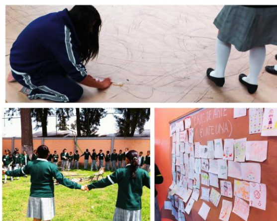
Figura 5. Programa “Alas y Raíces” AR3-. Taller “Dibujo y movimiento. Una botella al mar”, Escuela Secundaria Quetzalcóatl, Tláhuac, 2016.

El objetivo del programa “Alas y raíces” no buscaba formar artistas, generaba procesos que incentivaran el pensamiento crítico, así como coincidir punto de encuentro entre instituciones culturales, creadores y población adolescente (Figura 5).