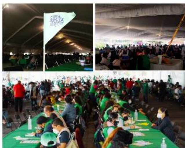
Figura 14. Atención en los módulos de vacunación COVID 2021, sede Tláhuac.

Una de las actividades que parte del personal de la Secretaría de Cultura realizó durante la contingencia fue el apoyo en diagnóstico de pruebas COVID, posteriormente se atendió a la población en los módulos de vacunación (Figura 16).