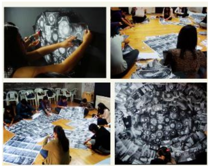
Figura 6. Programa “Alas y Raíces” AR3. Taller “Mural comunitario”. Museo Ex Teresa Arte Actual, 2015