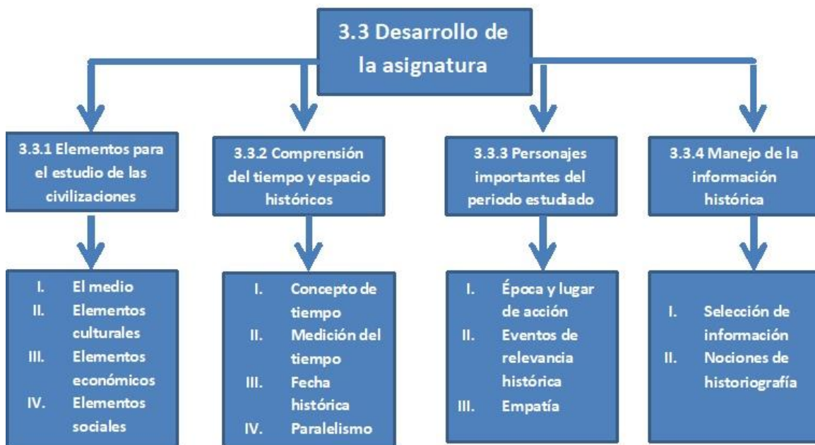
Imagen 3.- Desarrollo de la asignatura de Historia

Una vez establecidos los lineamientos de planeación se establecen parámetros para optimizar la impartición de cada tema. Lo idóneo es tener un esquema designado para cada uno de los aspectos importantes de la asignatura, ya que no todas requieren del mismo tipo de estrategias y actividades. También es importante especificar cuáles son los temas, habilidades y competencias que se buscan inculcar en los estudiantes; para fines prácticos, hice una separación de lo anterior, englobándolos en estos cuatro grupos principales, mismos que utilicé dependiendo de la competencia, tema o habilidad esperada.