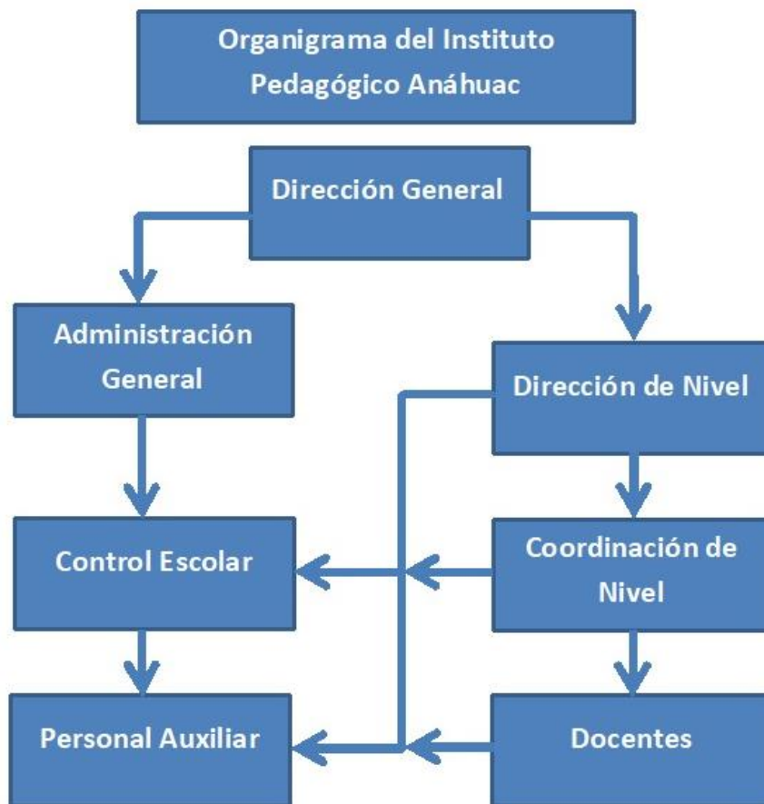
Imagen 1.- Organigrama del Instituto Pedagógico Anáhuac

Para fines prácticos, se describirán brevemente las funciones de cada una de las áreas del instituto Pedagógico Anáhuac. No obstante, debido a que las funciones desarrolladas se llevaron a cabo en el área de docencia, se hará más énfasis en las funciones de ese nivel.