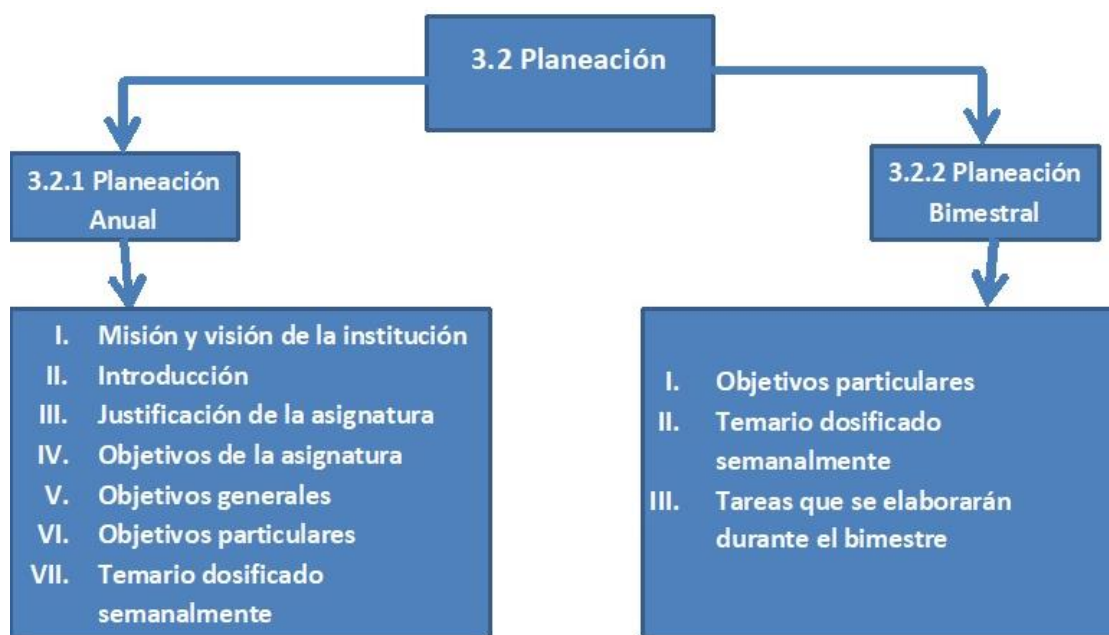
Imagen 2.- Estructura de la Planeación

Un docente no puede, bajo ningún concepto, confiar la eficacia de su clase solamente a la inspiración del momento, ni permitir que la impartición de la materia se dé de una manera arbitraria o caprichosa, sino que debe poseer un método y un camino claramente trazados desde mucho antes de plantarse en el aula, es por eso que la planeación juega un papel tan importante en su labor, al extremo de que una clase sin ella se considera como ineficiente, en el mejor de los casos. La planeación por asignaturas tiene como objetivos principales establecer los temas que se impartirán a los estudiantes a lo largo de un periodo determinado, así como las habilidades, valores y actitudes que se espera adquieran. Es un proceso sistemático que se elabora siguiendo lineamientos establecidos por el organismo gubernamental encargado de la regulación de toda la educación a nivel básico, a saber, la Secretaría de Educación Pública. En su elaboración se toman en cuenta la implementación de mecanismos que le permitan al docente hacer diagnósticos respecto a la realidad educativa en la que llevará a cabo su labor, identificar las necesidades del alumnado, así como del centro educativo, establecer prioridades respecto a ello, trazar objetivos y metas a corto y largo plazo, así como la creación de estrategias nuevas que permitan subsanar las problemáticas nuevas que surjan durante el periodo que abarcará la planeación.