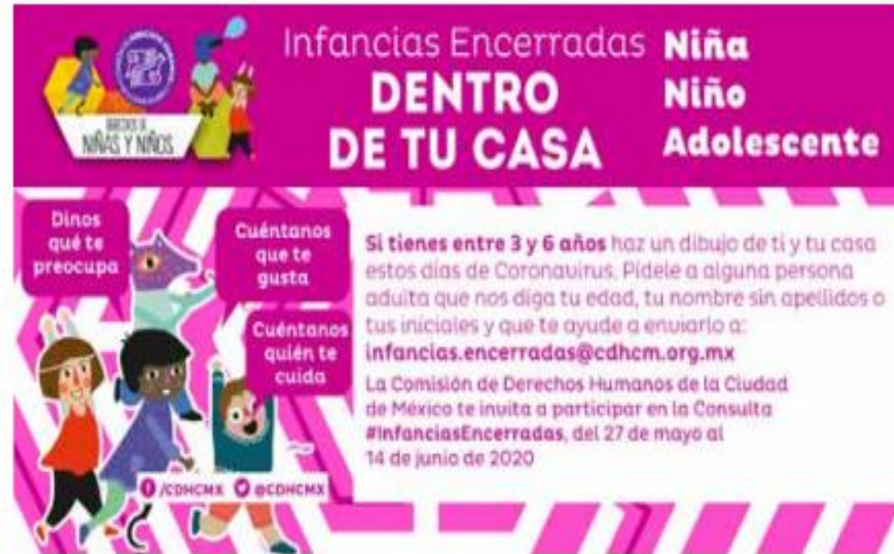
Imagen de la campaña #InfanciasEncerradas de la CDHCM 40 https://cdhcm.org.mx/infancias-encerradas/

Para poder identificar los estados de ánimo de las niñas y los niños se hicieron algunas preguntas abiertas, de las cuales se pudo conocer que a los más chiquitos les causa alegría que por primera vez está reunida toda la familia pero que han estado muy aburridos por la reducción de sus actividades cotidianas, muchos refieren que se entretienen en familia con los juegos de mesa o mirando películas.