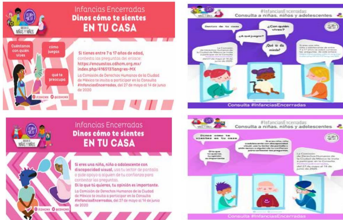
Imágenes de la campaña #InfanciasEncerradas de la CDHCM 36 https://cdhcm.org.mx/infancias-encerradas/

Del 27 de mayo al 15 de junio del 2020 se levantó una encuesta digital #InfanciasEncerradas 37 para que las niñas y niños de la Ciudad de México expresaran sus emociones respecto al confinamiento. Esta consulta consistió en un cuestionario con lenguaje accesible dirigido a niños y niñas de 6 a 17 años y la participación de niñas y niños de 3 a 5 años de edad, con dibujos. La encuesta está dividida en cinco rubros: