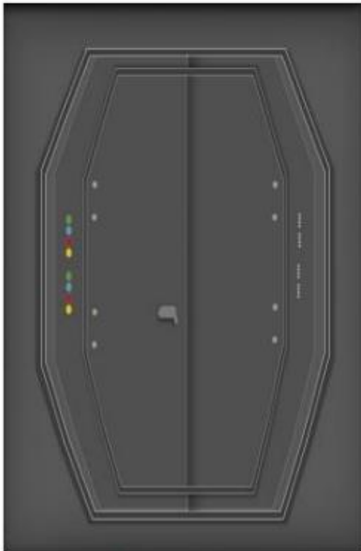
Vista lateral del interior de la nave