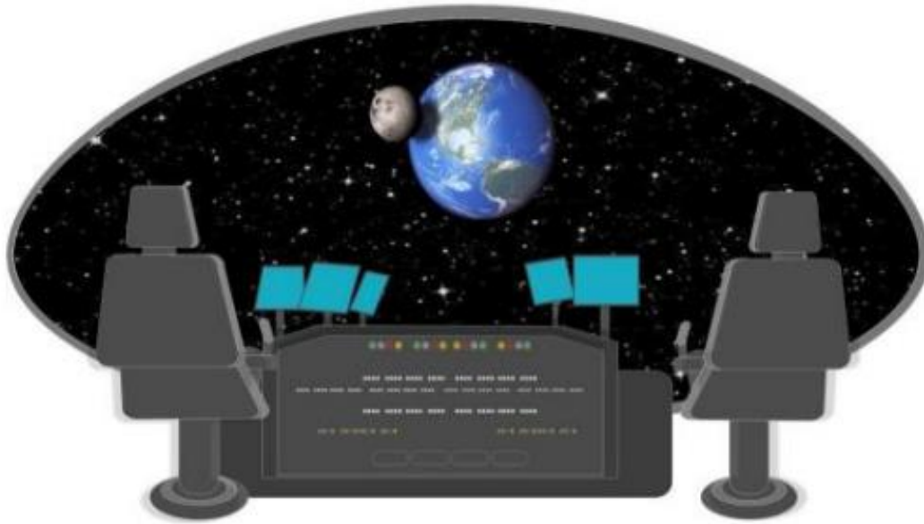
Interior de la Nave espacial marciana