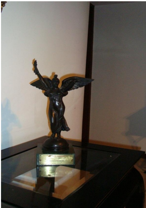
Trofeo a los mejores deportistas de Jalisco del siglo XX

“Si algo puedo agregar es que estoy muy orgullosa de ser su hija y del cariño que le tiene la gente. Al igual que mi hermana, si volviera a nacer, repetiría todo”.