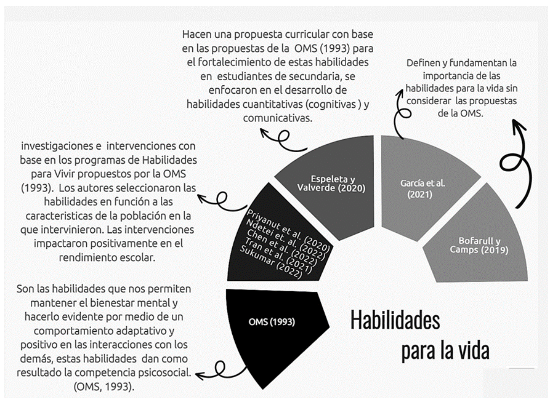
Figura 1. sintetiza las definiciones presentadas hasta ahora.

En este capítulo después de presentar las concepciones alrededor de las habilidades para la vida de diferentes investigadores, proponemos una definición de trabajo para este manuscrito, en el siguiente capítulo analizaremos cómo están conformadas y cómo se relacionan.