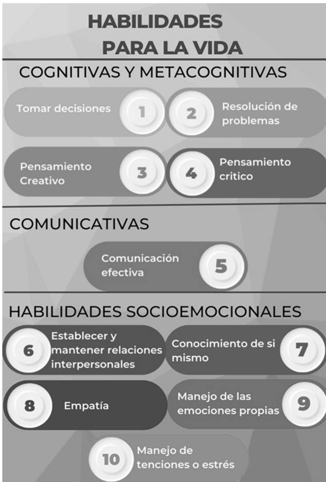
Figura 3. Habilidades para la vida (OMS, 1993) Se presentan las habilidades propuestas por la OMS (1993) separadas en las secciones mencionadas anteriormente. Elaboración propia.